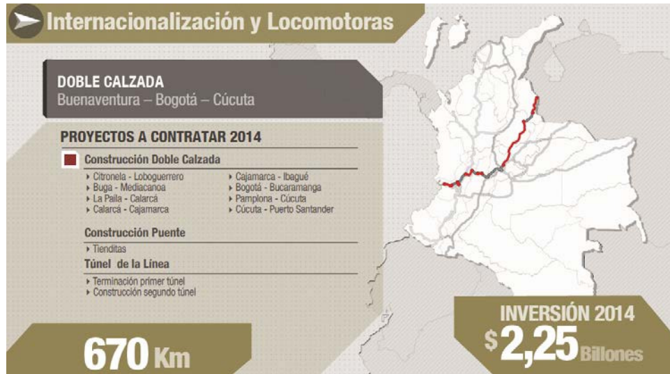
Gráfica 4. Nuevo corredor entre Llanos Orientales y Océano Pacífico