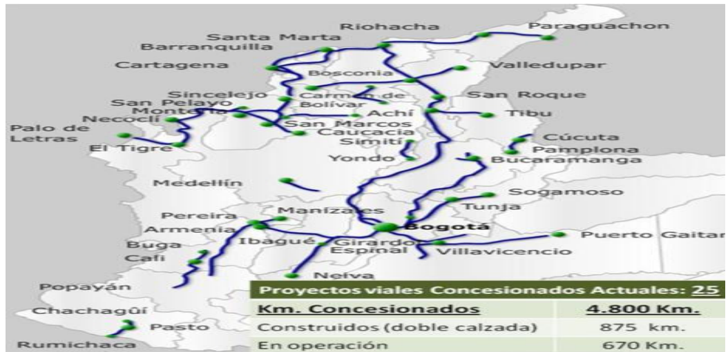
Gráfica 1. Mapa de proyectos viales concesionados

* El total de la dimensión de la red vial nacional es 16.559 kilómetros.