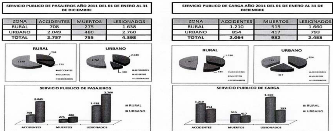
Gráfica 8. Accidentalidad servicio público de pasajeros y carga 2011.