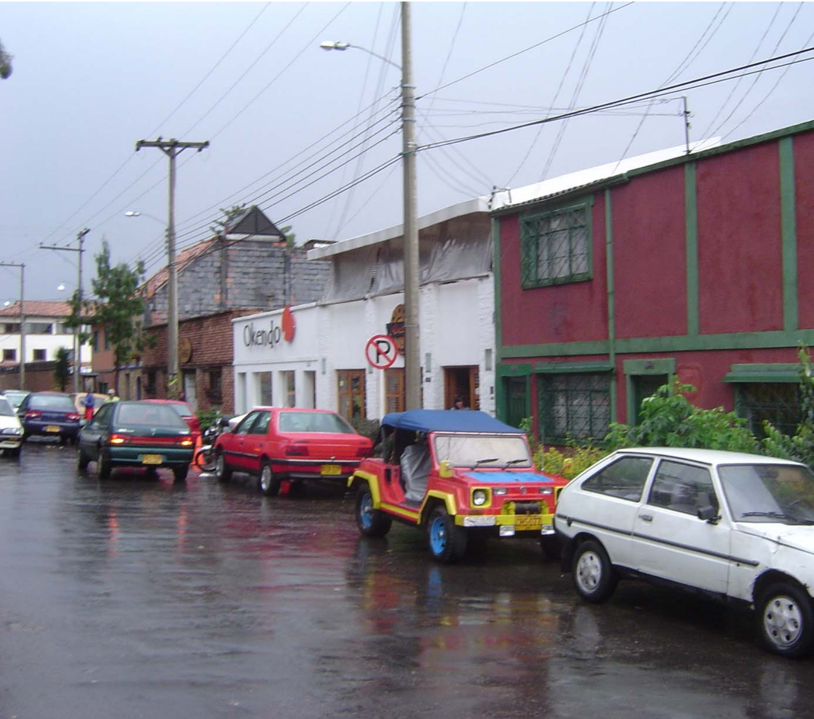
Usaquén (arriba de la 7ª)