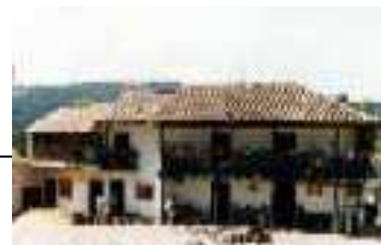
PANTANO DE VARGAS