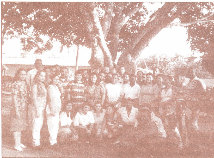
Grupo de personas que cursaron el programa de Ciencias Sociales en el Departamento del Guaviare.