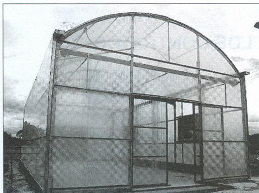
Estructura del Videocentro que procesará desechos orgánicos.

En este biocentro se pueden procesar 24 metros cúbicos de des-