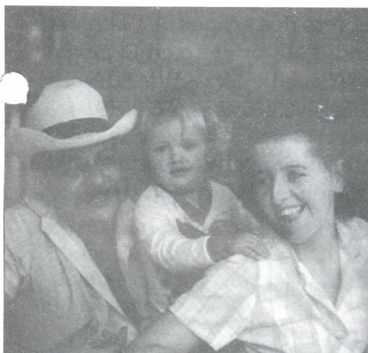
Los donativos se canalizarán a uno de los municipios más afectados.