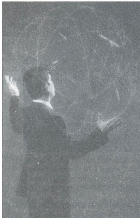
El Área identifica las necesidades de su público objetivo y promueve estrategias de comunicación y servicio.

En desarrollo de estos objetivos, el departamento apoya y agiliza los procesos que conlleven a volver más eficaces los esquemas de la Universidad, a nivel interno y externo; crea el ambiente y la mentalidad favorable para desarrollar la cultura y la estrategia de comunicación interna, con el compromiso compartido de las directivas y la comunidad universitaria. Así mismo, interrelaciona empleados y directivos de la Universidad, en cuanto a pensamiento y acción.