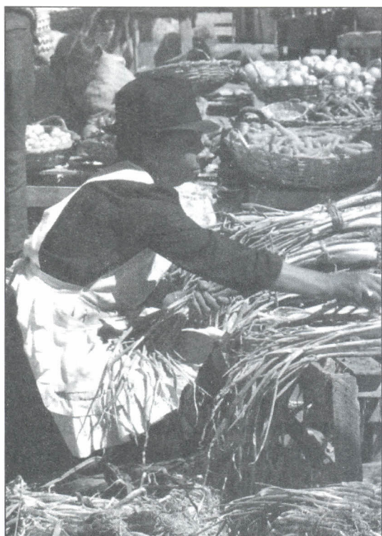
El proyecto impulsa iniciativas para el desarrollo del campo.