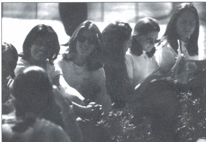
Los alumnos tuvieron la oportunidad de conocer los servicios que ofrece la Universidad.

Al evento, asistieron cerca de mil alumnos de todas las Facultades, quienes disfrutaron con la compañía del grupo musical "Manguaré". La actividad, en opinión de sus organizadores, dejó un resultado positivo por la acogida que tuvo entre los estudiantes.