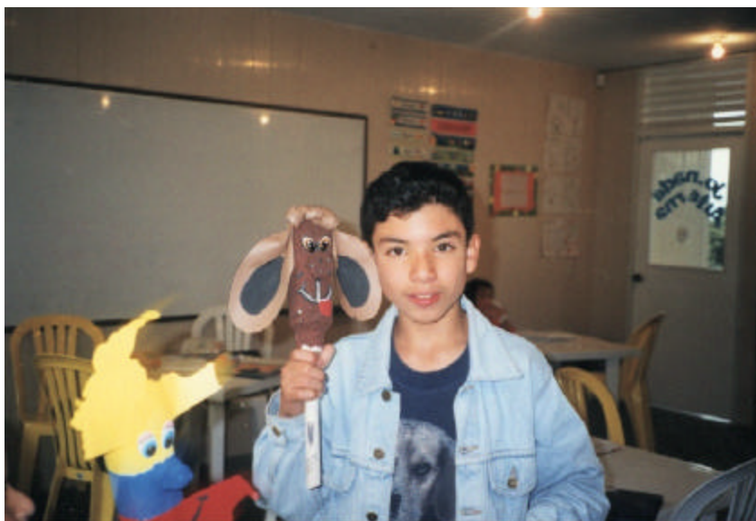
Figura 19 Fotografía “ Creatividad”

está, el entusiasmo no faltó y la agresividad disminuyó notablemente excepto por uno de los alumnos que comenzó a jugar de una manera agresiva con una botella. Sin embargo algunos días después cuando iba cogiendo más forma el títere este niño dejó a un lado la agresividad y se dedicó a terminar con el personaje que escogió para éste. Este tipo de actividades ayudan por un lado a que haya un mejor trato entre ellos, y por otro a utilizar su imaginación puesto que ellos eran los creadores de sus propios títeres y sus historias.