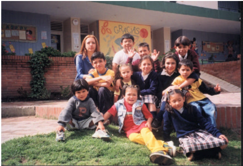
Figura 8. Fotografía Grupo Jornada Alterna

Este es un grupo muy heterogéneo, cuenta con niños de 6 a 15 años, motivo por el cual la actividad pedagógica es difícil de llevar a cabo, pues las necesidades de cada uno de los alumnos son diferentes dependiendo del caso y de la edad. La relación social del grupo es bastante agresiva, pues se dan golpes sin causa justificada aparentemente, y con demasiada frecuencia e intencionalidad. Pareciera entonces que la agresión en estos niños fuera una reacción natural de ellos, pero no se dan cuenta que con sus actuaciones generan una situación amenazante tanto dentro como fuera del aula.