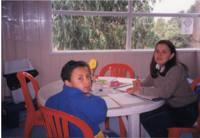
Figura 6. Fotografía del centro de apoyo “Oportunidad”

Uno de los programas banderas del Hogar Nueva Granada, son los talleres de microempresas en distintas áreas para los padres de familia y personas que viven en los barrios Bosque Calderón, Juan XXIII y Los Olivos. Éstos son ofrecidos a ellos y/o ellas con el propósito de lograr que visualicen una ventana de oportunidad para mejorar sus condiciones de vida a través del trabajo realizado por ellos mismos, y que además pueden implementar en sus hogares.