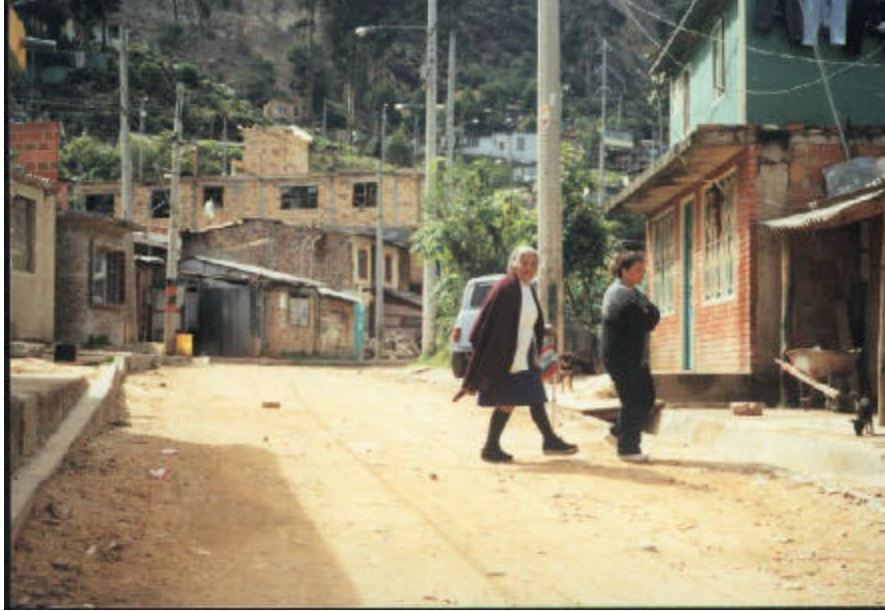
Figura 10. Fotografía de las familias

Las familias de los niños que están en la institución pertenecen a un estrato uno y dos. Algunas de ellas son familias monoparentales, ya sea porque nunca se casaron o vivieron en unión libre o por situaciones violentas que los ha llevado a perder a alguno de los cónyuges. También estos barrios cuentan con padres de familia, supremamente jóvenes quienes oscilan entre 16 y 17 años de edad y por este motivo se ven en la obligación de vivir con sus hijos pequeños, en la casa de alguno de sus padres compartiendo todos una misma alcoba sin tener ninguna clase de privacidad. La mayoría de estos padres no ha tenido escolaridad, y se ven obligados a trabajar tanto papá como mamá en trabajos de muy baja remuneración económica. Teniendo en cuenta todo lo anterior se puede