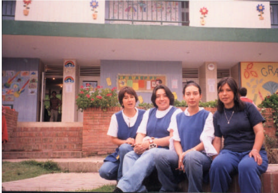
Figura 7. Fotografía de algunos docentes

El comité pedagógico del Hogar Nueva Granada lo conforman una asesora del Jardín Infantil Nueces y Pistachos, la directora del Hogar y los profesores del mismo. Este comité se reúne una vez al año para evaluar los distintos programas escolares, logrando así un fortalecimiento de éstos y a su vez analizar aquellos que no están cumpliendo los objetivos.