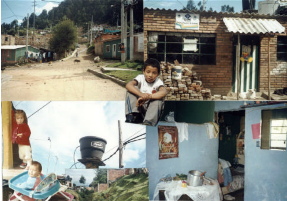
Figura 11. Fotografías del Contexto Local