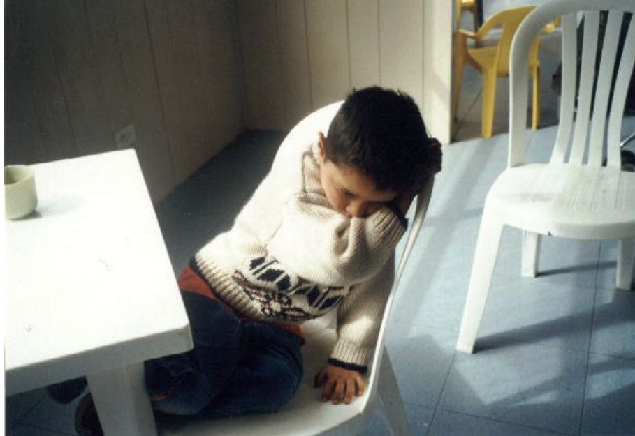
Figura 18. "FOBIA ESCOLAR"

En la actividad sobre el cuento con un personaje imaginario se logró obtener una serie de información acerca de las experiencias vividas de los niños no solo en el entorno familiar sino también en el escolar. Los niños adoptaron este personaje dejando salir a través de este sus historias de vida en las que se refleja con claridad la violencia intrafamiliar y la inconformidad hacia los maestros violentos que hay en las escuelas a las que pertenecen. Estos maestros los agreden verbalmente dejando en ellos una huella que se ya se refleja en una baja autoestima, y en una fobia escolar.