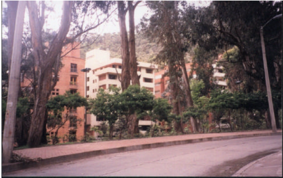
Figura 13. Fotografía del barrio vecino “Rosales”

En cuanto a los servicios médicos que hay en el sector se encuentran los siguientes: