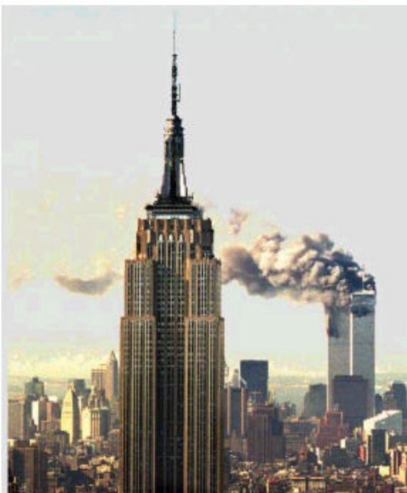
Figura 15. Fotografía Desastre en Nueva York

El amanecer del siglo XXI muestra los mismos pasos de su antecesor impregnándose de terrorismo mundial como el 11 de septiembre y local, con injusticias, pobreza, desplazamiento y dolor entre innumerables problemas sufridos por la población en general.