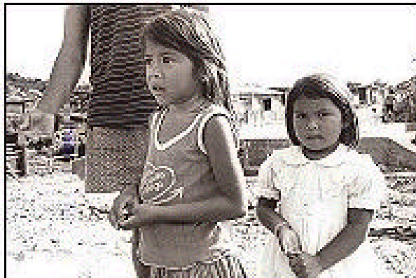
Figura 16 Fotografía Niños desplazados por la violencia

El desplazamiento es un problema de dimensiones inmensas, pues se desarraigan familias enteras de su hábitat, la pobreza aumenta y los niños se convierten en las principales víctimas en todo este conflicto. Las experiencias traumáticas vividas por estos niños son un foco de violencia que puede renacer en el futuro como resultado de los traumas causados, y que se ven reflejados en el desarrollo social de estos.