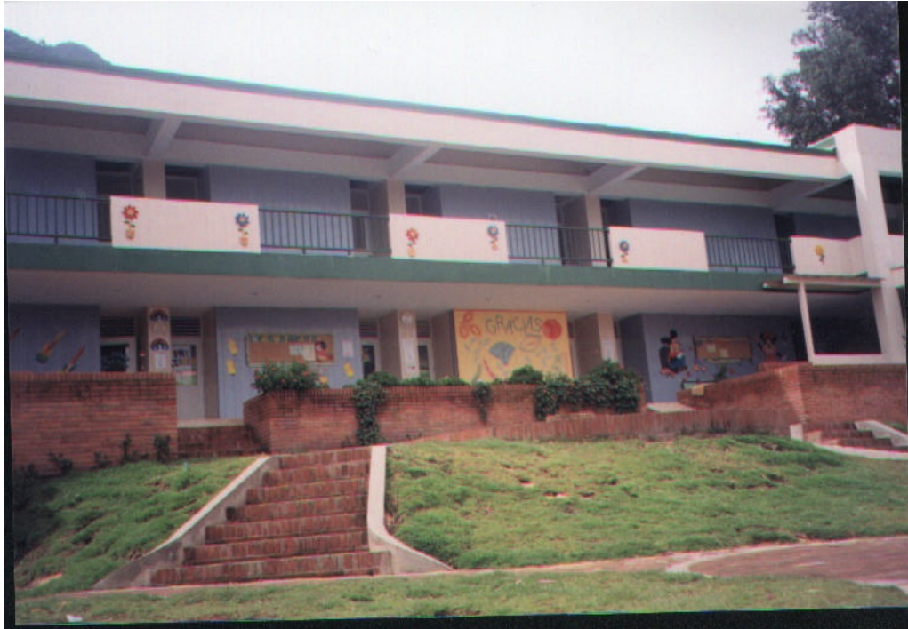
Figura 1. Fotografía del Hogar Nueva Granada

El Hogar Nueva Granada es una institución privada sin ánimo de lucro, ubicada al nororiente de la ciudad de Bogotá, fundada el 8 de Noviembre de 2001 por la comunidad del Colegio Nueva Granada. Presta servicios de preescolar, jornada alterna, alimentación, psicología, salud y odontología en el sector conocido como Barrios Unidos de Bogotá, Colombia.