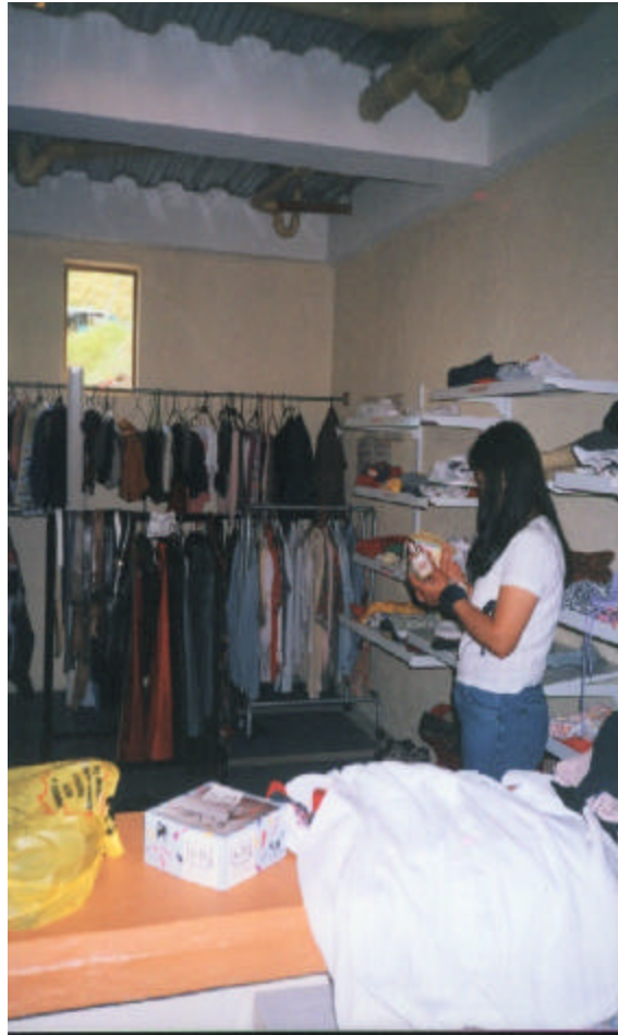
Figura 4. Fotografía del almacén

Por otro lado, a los niños del hogar se les ofrece un servicio médico básico en el que se lleva un control estricto de la salud física de cada uno de los niños y niñas, que tiene en cuenta el crecimiento, desarrollo, vacunación y remisión a centros hospitalarios cuando se requiere. Además, atienden consultas médicas constantemente en las áreas de pediatría y medicina general para toda la comunidad aledaña.