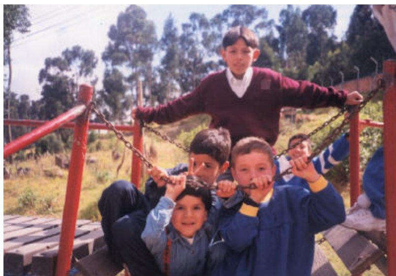
Figura 2. Niños de la Institución

En cuanto a la selección de los niños que ingresan al Hogar Nueva Granada se tiene en cuenta que vivan en uno de los tres barrios vecinos: Juan XXII, Los Olivos o Bosque Calderón; que las entradas económicas de estas familias sean tan bajas que no alcancen para pagar la educación inicial de sus hijos; que no cuenten con los medios económicos para darles una buena nutrición ni tampoco un control médico, entre otros requisitos.