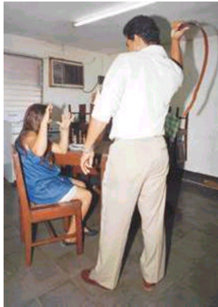
Figura 17. Fotografía Maltrato Intrafamiliar

Se entiende por violencia intrafamiliar al conjunto de actitudes y acciones que se expresan con agresiones físicas, psicológicas y sexuales que una persona tiene con otro miembro de su familia. La violencia intrafamiliar afecta a mujeres, hombres, hijos, abuelos y otros miembros de la familia. 3