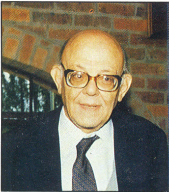
Dr. LEONARDO POLO

El profesor Leonardo Polo es Catedrático de Historia de la Filosofía y profesor de la Universidad de Navarra (España). En 1984, visitó la Universidad de La Sabana por primera vez. Regresó en agosto de 1989 para dictar unas conferencias y un Curso Monográfico sobre EL CONOCIMIENTO DE LO REAL.