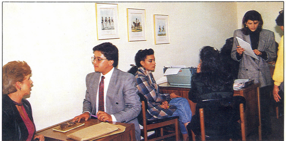
Centenares de personas acuden al Consultorio Jurídico de la Universidad a buscar asesoría para resolver problemas de carácter civil, público y penal. Los estudiantes de esta Facultad, orientados por sus profesores, atienden las necesidades de quienes se acercan a esta dependencia.

Además de la asesoría que ofrecen en el Consultorio Jurídico, algunos alumnos están encargados de brindar este servicio en las cárceles "El Buen Pastor" y "La Modelo", a personas de escasos recursos.