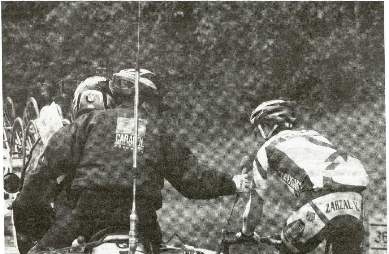
Las transmisiones de la Vuelta a Colombia están a la espera de un relevo generacional, que les dé nuevo aire.

Por esa razón, los tiempos al aire también se han reducido. Si en épocas gloriosas las emisiones duraban ocho horas, ahora tan solo las dejan cuatro. Además, no están abiertas al canal nacional, esto pasa sólo poco antes de la llegada, sino que hacen parte de una parrilla de programación que van adecuando según necesidad. Los únicos que parecen poder oír sin interrupciones la etapa son aquellos automóviles que van en