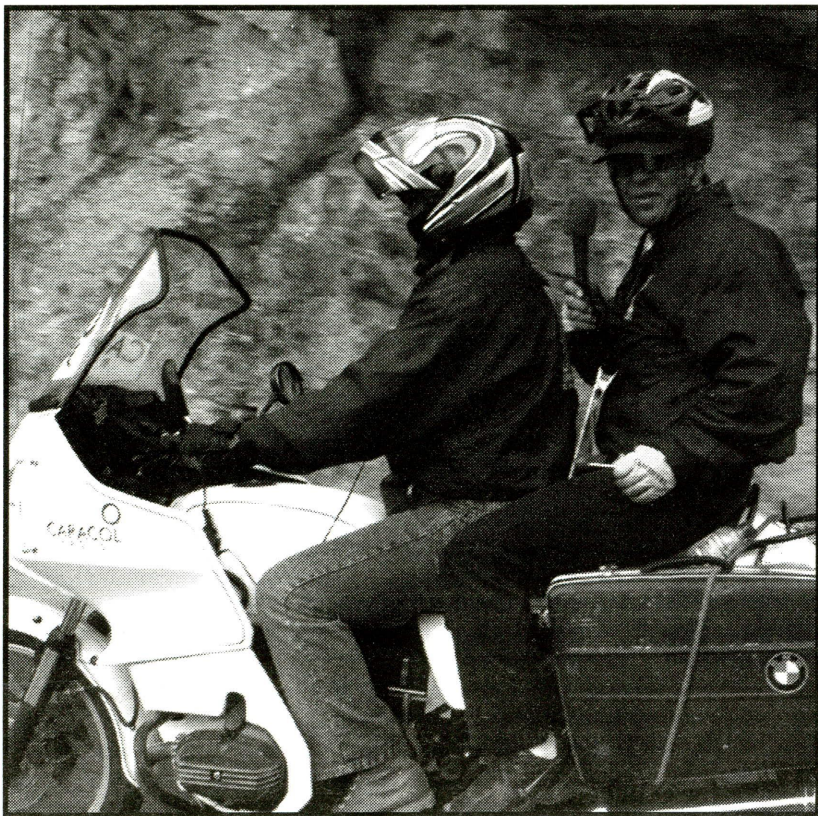
Con las transmisiones que hacían las grandes cadenas radiales de la Vuelta a Colombia muchos conocieron los más inimaginables lugares del país.

De lo que se trata aquí es de volver a llamar la atención sobre la irresponsabilidad de un periodismo exitista, descontextualizado, exagerado y desmesurado tanto en la crítica como en el elogio. Un periodismo resultadista, que no ve más allá de su conveniencia comercial o institucional, que se vanagloria con los logros y se escandaliza con los fracasos sin generar análisis y, siendo esto lo peor, se aleja de su obligación de construir una efectiva orientación de la opinión pública.