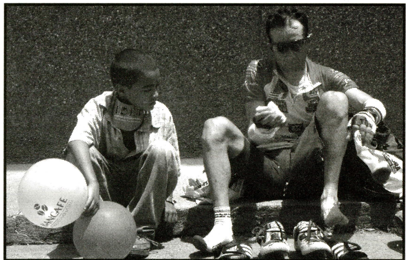
Pese al abandono de los medios, el ciclismo sigue cautivando al público.

Llegó el año 1994. Atrás quedaron los gloriosos años ochenta donde la temática informativa era el ciclismo, donde los ídolos colombianos se forjaban en las carreteras resquebrajadas del país e