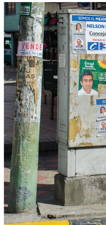
En la localidad de Kennedy, las cajas te

En la localidad de Santa Fe, la norma se incumple en esta propiedad privada porque los afiches fueron colocados sin el consentimiento del propietario o poseedor.