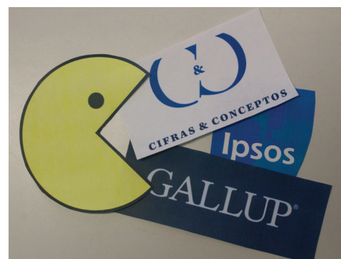
Fotomontaje: Rodrigo Alejandro Munévar

En todo caso, si usted no ha decidido por quién votar, es recomendable que no se quede únicamente con resultados porcentuales. Haga la tarea completa: mire, analice, contraste, compare y, sobre todo, infórmese.