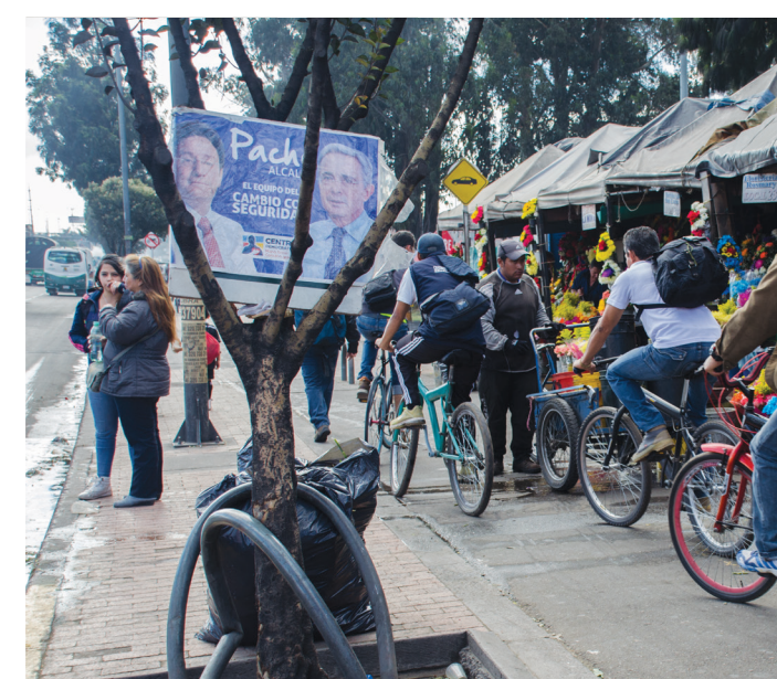
Francisco Santos le dijo a En Directo que en su campaña no imp