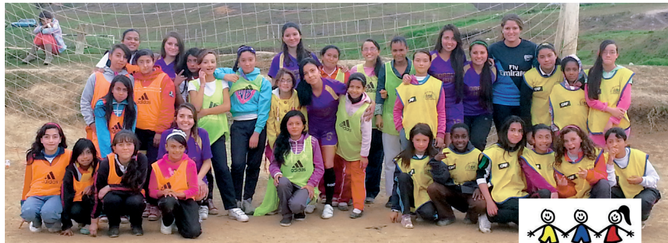
■ El equipo de fútbol femenino del Programa de Derecho "Corpus Iuris F.C." junto a los niños de la Fundación colombianitos"

El 8 de noviembre, estudiantes de la Facultad de Derecho y Ciencias Políticas, realizaron una visita a la Fundación Colombianitos en Ciudad Bolívar, con el fin de compartir un tiempo especial y un juego de fútbol en el que los valores fueron la enseñanza.