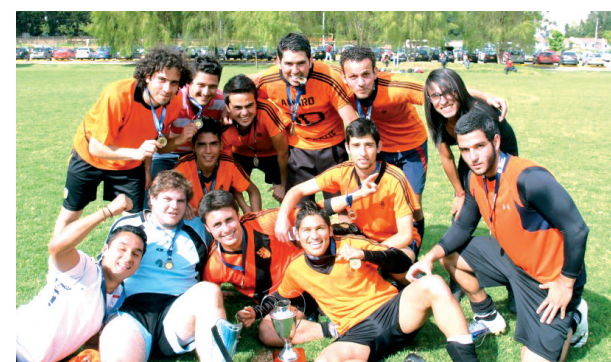
■ Integrantes de "El Bufete".

A continuación, presentamos el número de personas conectadas a los eventos transmitidos, de acuerdo con la información ofrecida por los técnicos de RENATA: