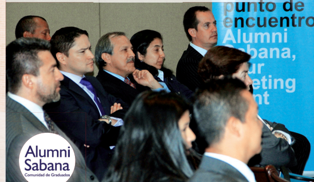
■ Graduados asistentes a la actualización académica, durante la conferencia "La Motivación, ¿un camino hacia el compromiso?"

Con el interés de fortalecer la relación con los graduados y apoyar su continuo desarrollo profesional y personal, Alumni Sabana llevó a cabo la Jornada de Actualización Académica para graduados de especializaciones y maestrías, el martes 20 de noviembre, en la sede del Gun Club.