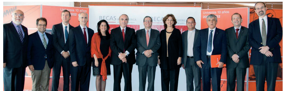
■ Rectores de las universidades que firmaron el convenio de Becas Iberoamérica Santander Universidades.

nios de entrega de cinco becas de movilidad para estudiantes de pregrado a cada una de las 16 universidades colombianas seleccionadas, entre ellas la Universidad de La Sabana, como muestra de su compromiso con la educación superior en Colombia. También, se realizó el lanzamiento de 10 becas de convocatoria abierta para jóvenes profesores e investigadores dirigidas a las universidades socias y vinculadas a Universia, las cuales se pueden consultar en http://especiales.universia.net.co/becas-santander .