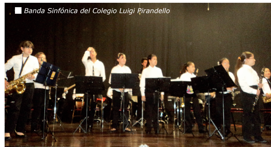
■ Banda Sinfónica del Colegio Luigi Pirandello

Bienestar Universitario, desde la Jefatura de Desarrollo Cultural, invita a estudiantes y empleados a disfrutar de 'Lunes de recital' con la Banda Sinfónica del Colegio Luigi Pirandello.