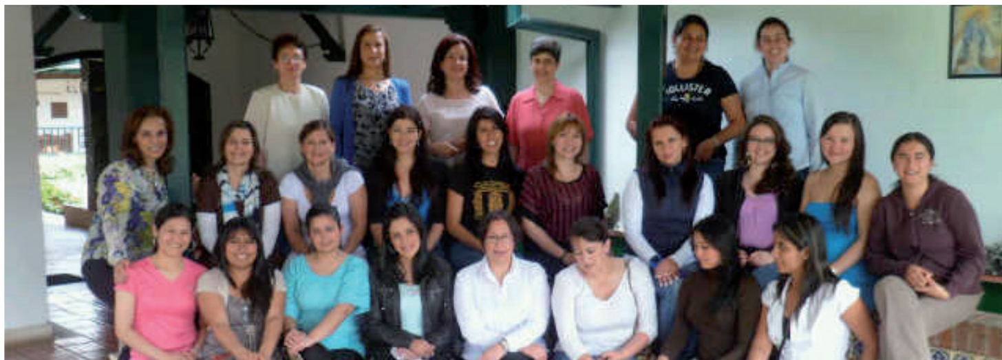
■ Participantes de la primera convivencia de maestrías y doctorado.

El 30, 31 de mayo y 1 de junio en Torreblanca, Silvania, se realizó la primera convivencia de estudiantes de maestrías, con la participación de 27 estudiantes y directoras de los respectivos programas participantes: Maestría en Dirección y Gestión de Instituciones Educativas, siete estudiantes; Maestría en Educación, ocho estudiantes; Maestría en Diseño y Gestión de Procesos, tres estudiantes; Maestría en Gerencia de procesos, una estudiante; Doctorado en Biociencias, una estudiante; y Maestría en Informática, dos estudiantes.