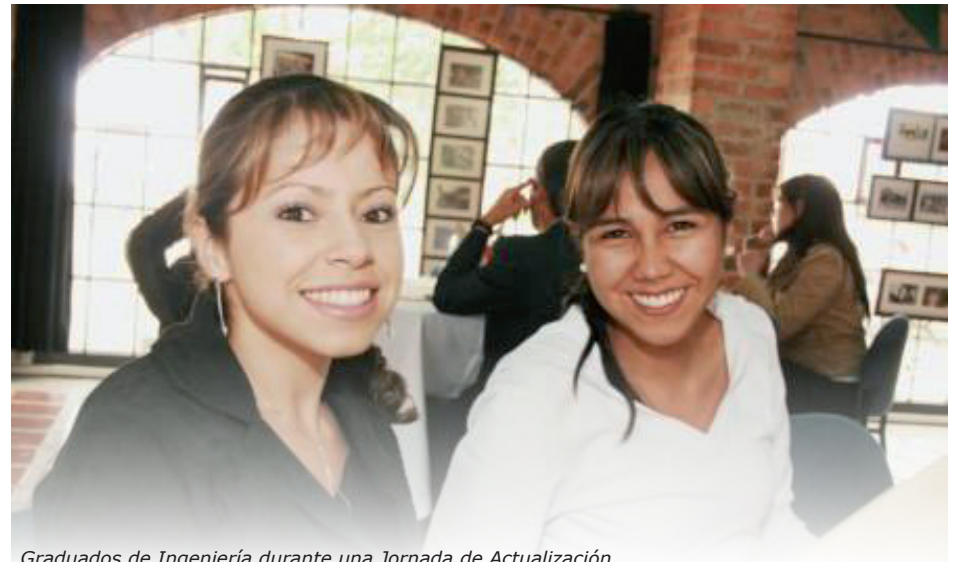
Graduados de Ingeniería durante una Jornada de Actualización.