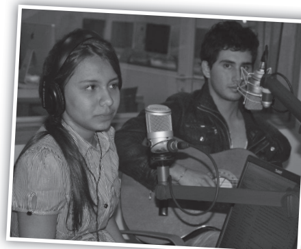
US BAND, banda representativa de la Universidad.