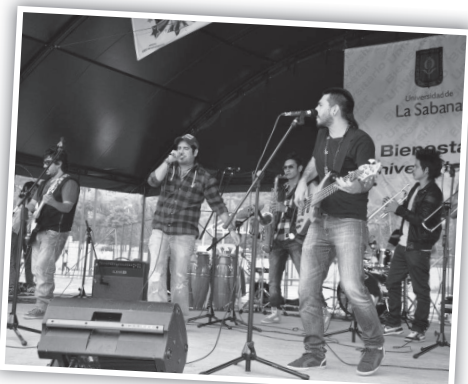
Concierto de aniversario con Katamarán en Arena Sabana.