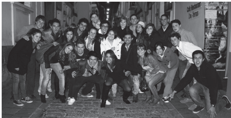
Estudiantes de la Universidad de La Sabana y de la Universidad de los Hemisferios en Quito.