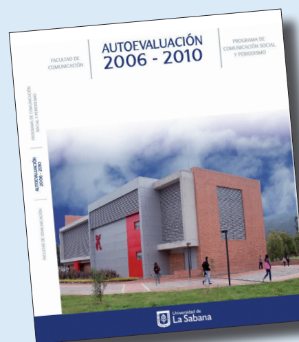
Portada informe de Autoevaluación

Ahora el proceso sigue con la designación, por parte del CNA, de los pares evaluadores y su fecha de visita a la Universidad, que está proyectada para finales de 2011 o inicios de 2012.