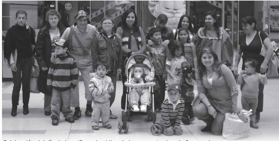
Celebración del día de los niños a los hijos de los secuestrados el año pasado.

“El objetivo de la jornada es darles apoyo brindándoles actividades apropiadas para que puedan compartir y gozar el hecho