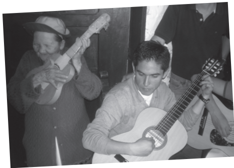
Estudiantes visitaron el Ancianato San Vicente de Paul en Silvania (Cundinamarca) en 2010.

Si quieres colaborar puedes contactarte con el Grupo Pharos o con la Dirección de Estudiantes de tu Facultad.