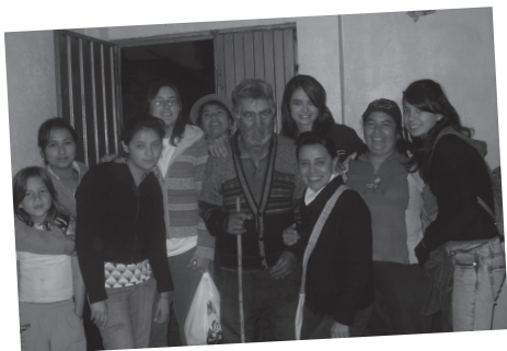
En 2009, estudiantes realizaron labores sociales en Funes (Nariño).