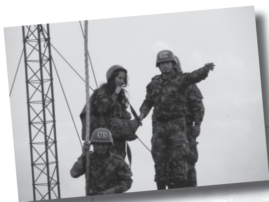
Estudiante durante el simulacro de paracaidismo.