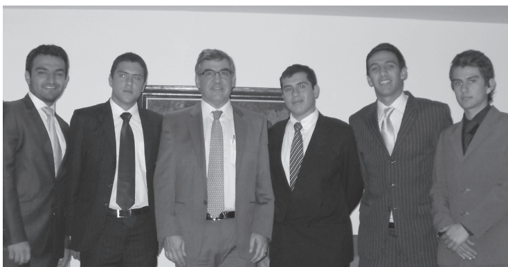
El Dr. Luis Ernesto Mejía, Ministro de Minas y Energía durante el período 2002-2006, y un grupo de estudiantes de la Facultad de Ingeniería y de la Escuela Internacional de Ciencias Económicas y Administrativas.

José Obdulio Gaviria, asesor del expresidente de la República Álvaro Uribe Vélez y Luis Ernesto Mejía, Ministro de Minas y Energía durante el período 2002-2006, estuvieron reunidos con medio centenar de estudiantes (en su mayoría estudiantes de La Sabana) con motivo del VI Ciclo de Conversatorios con Líderes, evento realizado en la Residencia Ingará y auspiciado por la Facultad de Ingeniería y la Escuela Internacional de Ciencias Eco-