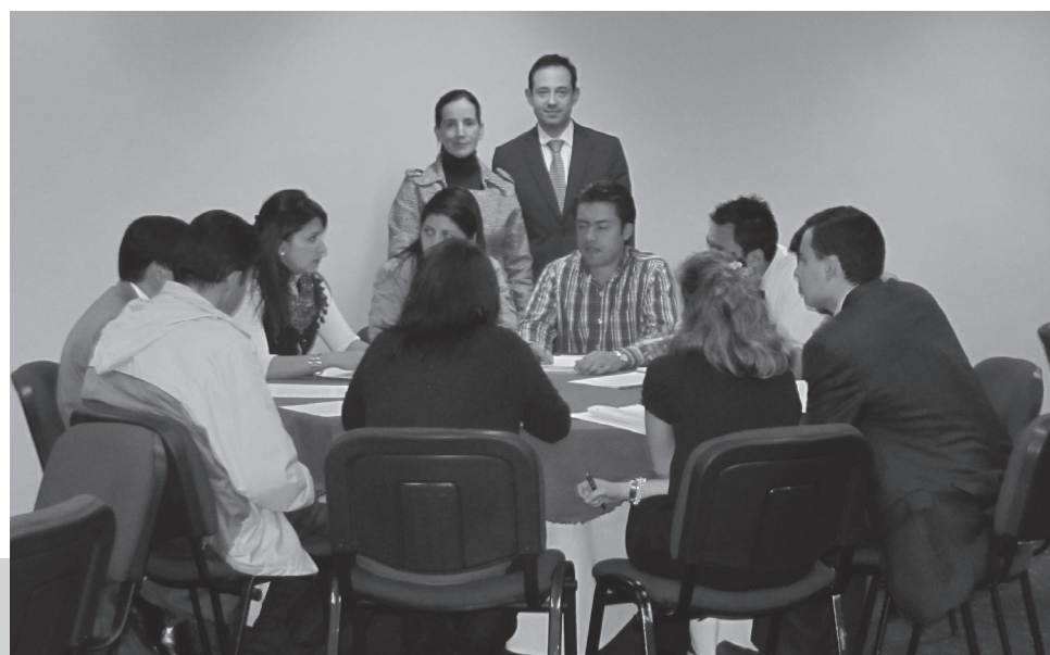
Algunos de los graduados durante el trabajo en equipo previo a la sesión.

Alumni Sabana y EDIME – Formación y Desarrollo Gerencial, buscando que los graduados de la Universidad sigan preparándose profesionalmente, se unieron para darles a conocer los programas que ofrece EDIME y las oportunidades de mejora profesional con que cuentan en su Alma Máter.