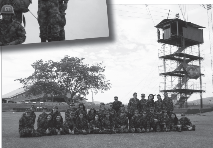
Estudiantes junto a la torre de lanzamiento de paracaidismo.

Los días 28, 29 y 30 de septiembre se llevó a cabo la convivencia de mujeres donde participaron 32 estudiantes de la Facultad de Comunicación. Durante la jornada pudieron realizar actividades de formación, integración y entretenimiento.