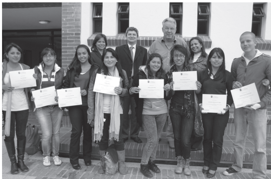
Algunos estudiantes de semilleros de investigación y pasantes de la práctica investigativa de la Facultad de Psicología.

El objetivo del curso fue estimular la formación en investigación a la luz de las tendencias internacionales contemporáneas, destacando el rigor académico, la ética y el espíritu de servicio, aspectos que se caracterizan como valores fundamentales en todo investigador. El curso tuvo una duración de 16 horas y se realizó del 9 al 15 de agosto.