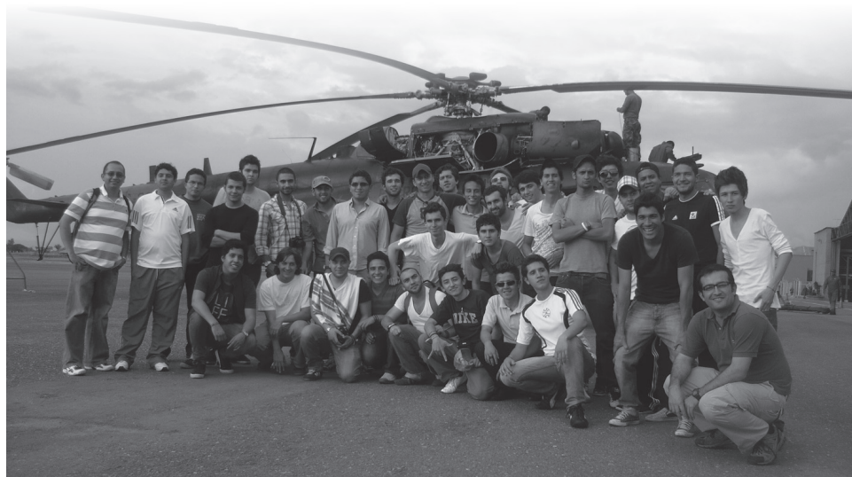
Convivencia de hombres realizada en septiembre de 2010.

La Facultad de Comunicación invita a todos sus estudiantes a las convivencias que se realizarán en el Centro Atarraya, ubicado en Silvania (Cundinamarca).