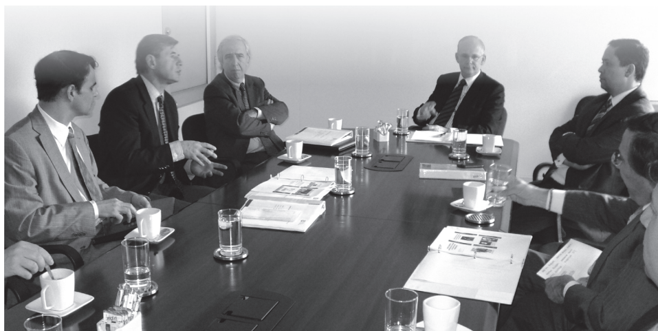
Momento de la reunión presidida por el Rector y el Vicerrector.

Dentro de la agenda del día se realizó una visita por el Campus universitario donde valoraron los adelantos en la recupera-