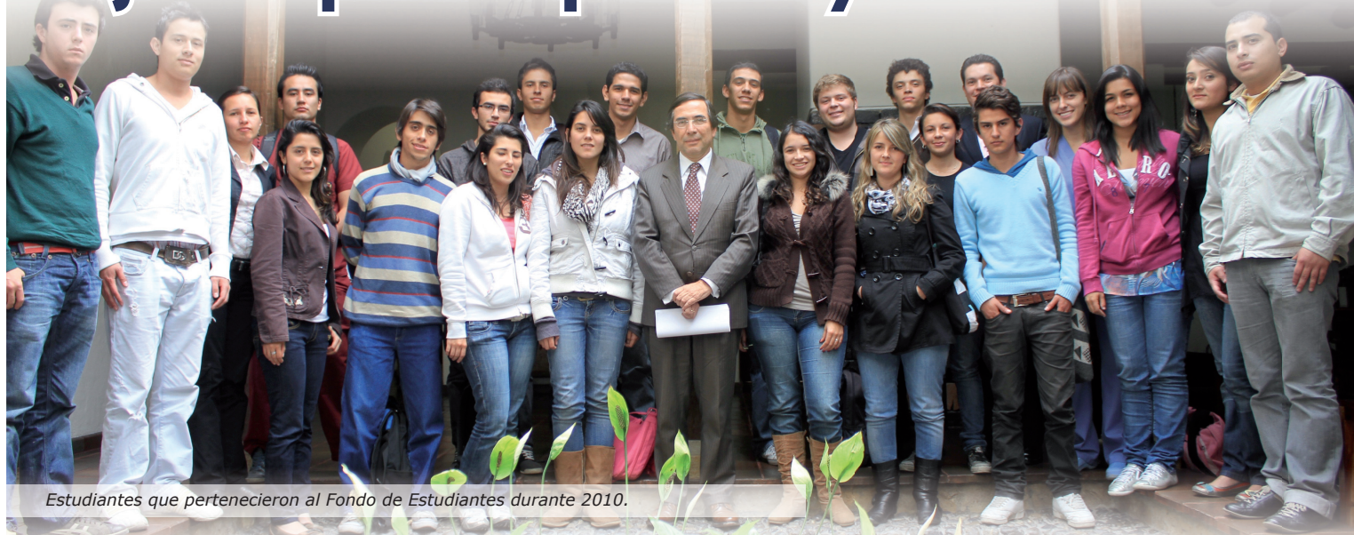
Estudiantes que pertenecieron al Fondo de Estudiantes durante 2010.

E l Fondo de estudiantes brinda a los alumnos de la Universidad la oportunidad de administrar un conjunto de recursos económicos, que se aplican para financiar inversiones y servicios de bienestar, destinados a los estudiantes de pregrado, adicionales o complementarios de los programas de bienestar que ofrece la misma Universidad.