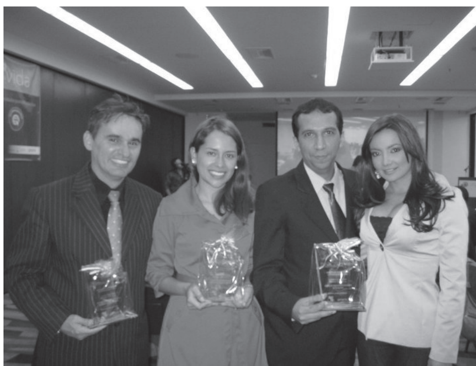
Los ganadores en categoría web universitaria, radio y televisión.

Los criterios de evaluación incluyeron: calidad del trabajo periodístico, veracidad e investigación; contribución efectiva para la mejor comprensión de la problemática de la donación de órganos y tejidos, manejo de diversas fuentes de información y originalidad.