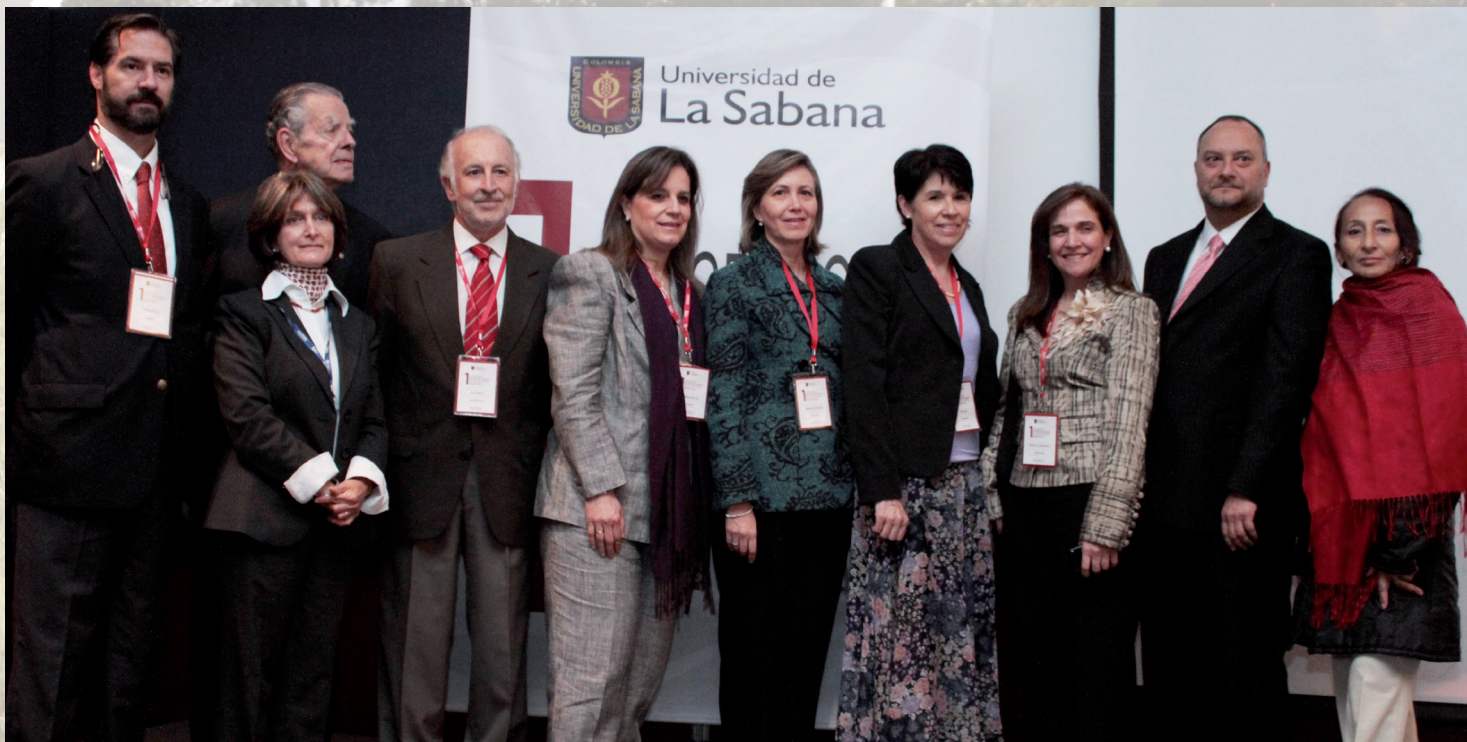
Durante el acto de inauguración, el grupo de Directivas de la Universidad, organizadores del Congreso y algunos conferencistas nacionales e internacionales.

Para los expertos, esta tendencia puede causar infartos de miocardio o accidentes cardiovasculares, entre otros inconvenientes en la vida adulta. Según los especialistas, esto se debe a los niveles de sedentarismo infantil que están contribuyendo al aumento