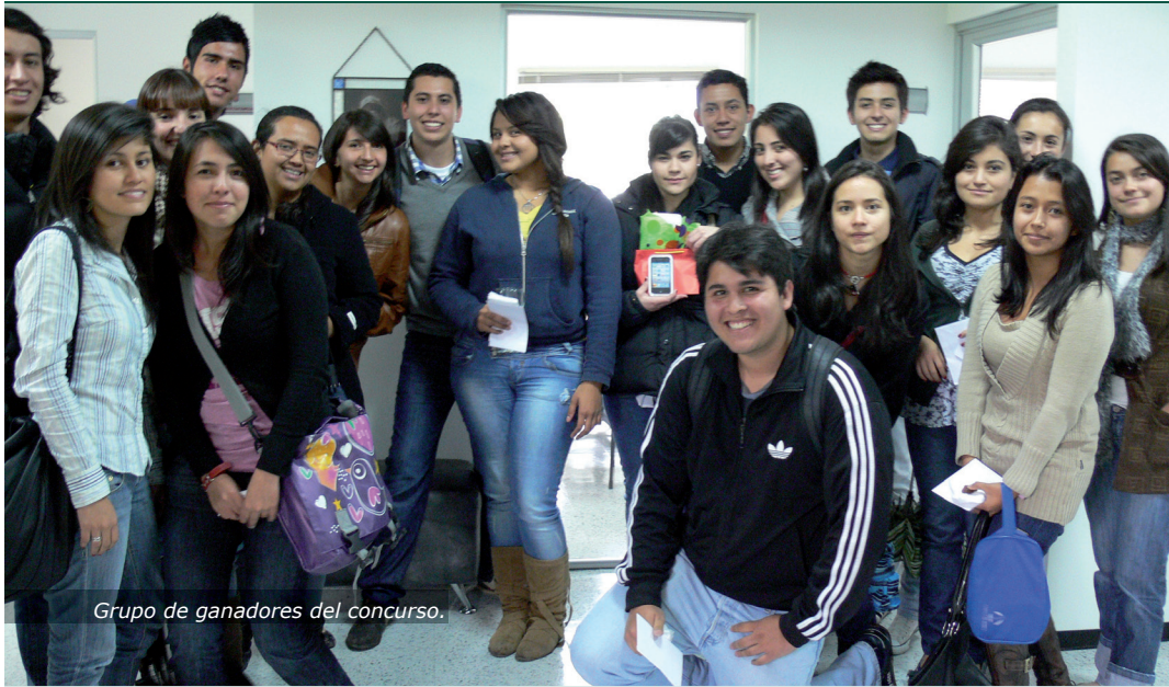
Grupo de ganadores del concurso.