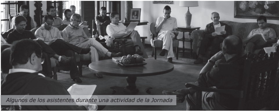
Algunos de los asistentes durante una actividad de la Jornada