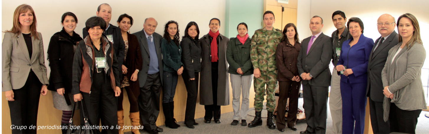
Grupo de periodistas que asistieron a la jornada

18 periodistas de medios masivos y especializados estuvieron en el Campus el martes 1 de marzo, participando en la I Jornada de Actualización para Periodistas de la Fuente Iglesia: Estructura de la Iglesia Católica e Introducción a la Beatificación del Papa Juan Pablo II , invitados por la Jefatura de Co-