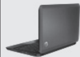
HP MINI 210-1035LA $ 815.000