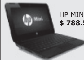
HP MINI 1103020LA $ 788.500