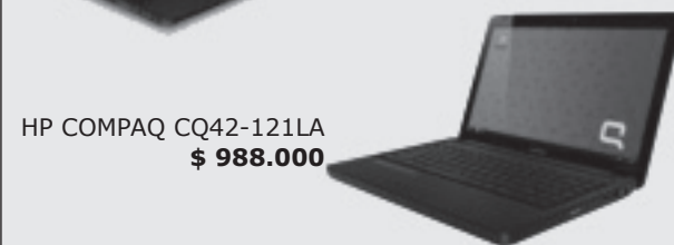
HP COMPAQ CQ42-121LA $ 988.000