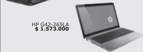
HP G42-265LA $ 1.573.000