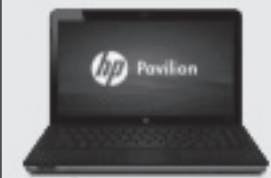
HP DV5-2046LA $ 1.898.000