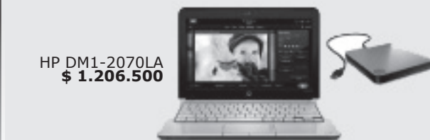
HP DM1-2070LA $ 1.206.500

Reclama obsequio... funda, minimouse, o USB de 4GB.