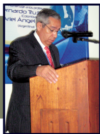
Antonio Silva Oropeza (México) Presidente del Instituto Iberoamericano de Derecho Concursal - Capítulo Colombiano