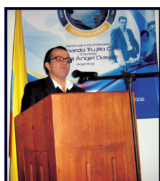
El estado de la economía nacional y sus perspectivas Dr. Óscar Iván Zuluaga, actual Ministro de Hacienda