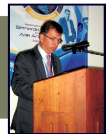
Germán Monroy: Presidente del Instituto Iberoamericano de Derecho Concursal - Capítulo Colombiano