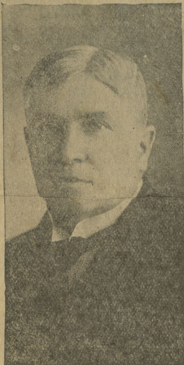
GENERAL SALVADOR FRANCO

El general Franco fue gobernador de Cundinamarca, y durante el perio-