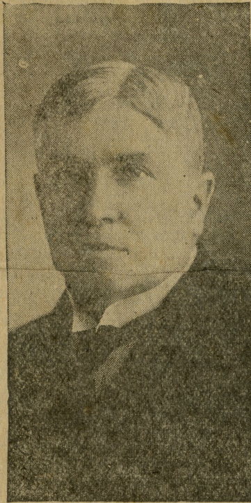
GENERAL SALVADOR FRANCO

El general Franco fue gobernador de Cundinamarca, y durante el perio-