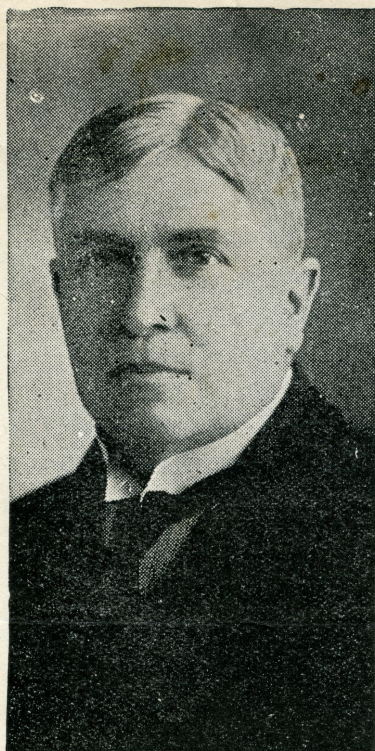
GENERAL SALVADOR FRANCO