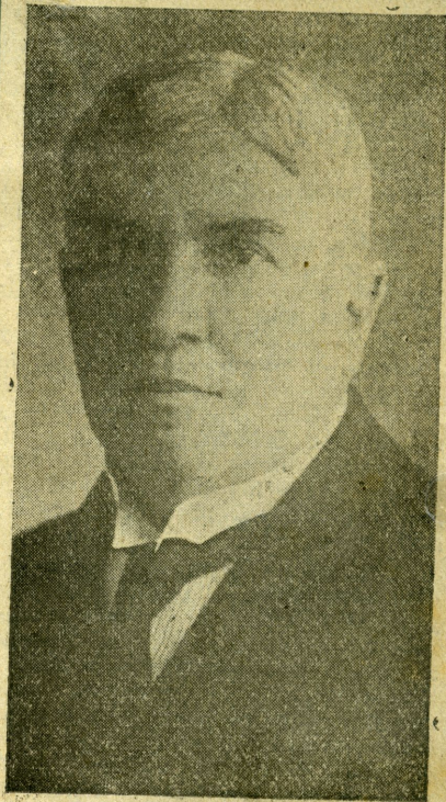
Gral. Salvador Franco, ministro de industrias.

Si dentro del sencillo plan de trabajo a que el general Franco ha prometido someter las actividades de su ministerio, logra en breves días darle a esa oficina una organización acertada, el apocalíptico derroche de los dineros fiscales dejará de ser una pesadilla para los colombianos y las obras públicas entrarán al fin en un período de realización, sometidas a un control efectivo que reducirá su costo, hoy fantástico, a proporciones siquiera tolerables.