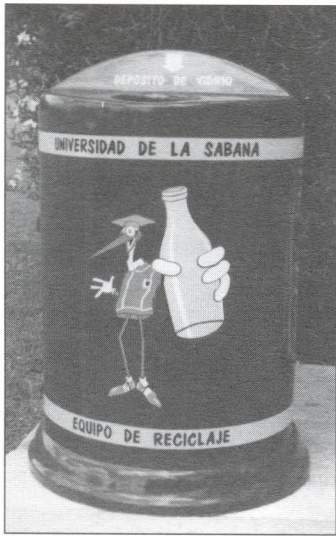
La Campaña de Ecogarza, fomenta la cultura del reciclaje en la Universidad