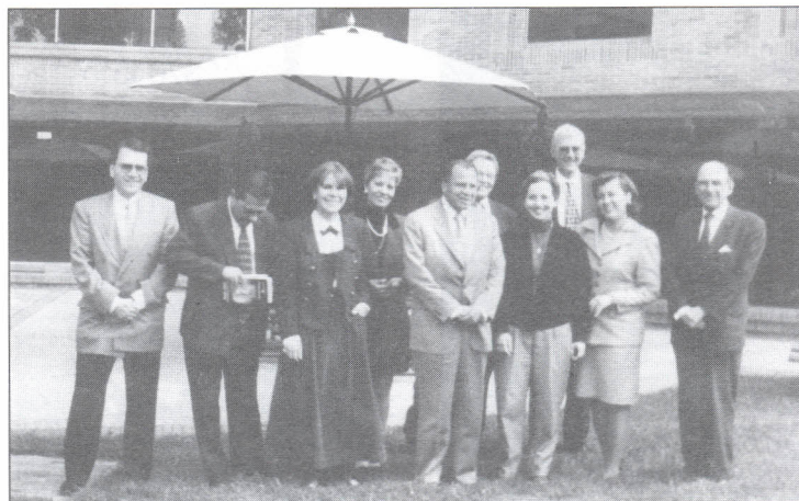
Participantes de la última reunión que se realizó en el Inalde