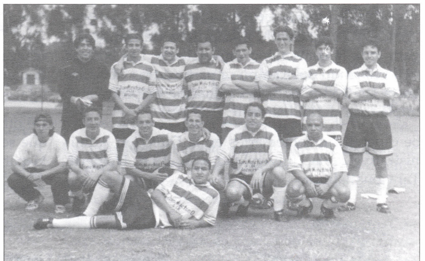
El partido entre los Equipos Argentina (Arriba) y Sporting Lisboa (abajo), hizo parte de la premiación en deportes