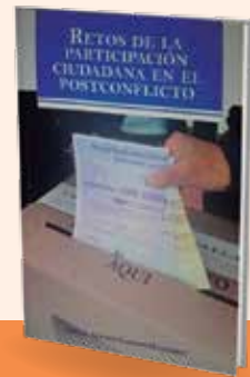
Tabla de contenido: https://bit.ly/2O77jrR .

Retos de la participación ciudadana en el postconflicto