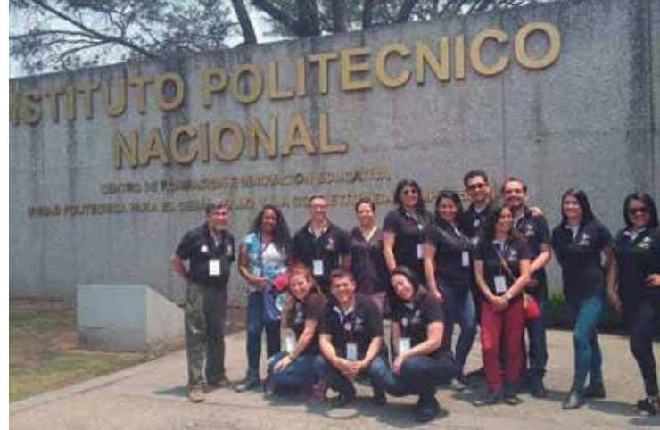
Estudiantes y profesores de la Maestría en Pedagogía asistieron al "Primer Encuentro Latinoamericano de Investigación Educativa y del Saber Pedagógico" en México.