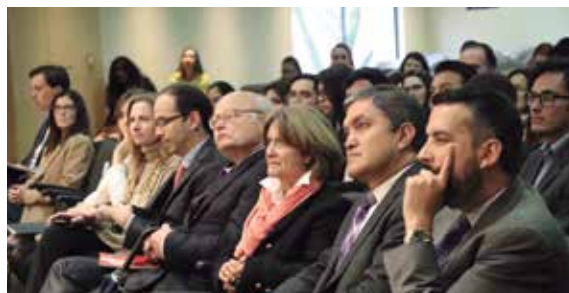
Directivos de las diferentes facultades y unidades asistieron al evento.