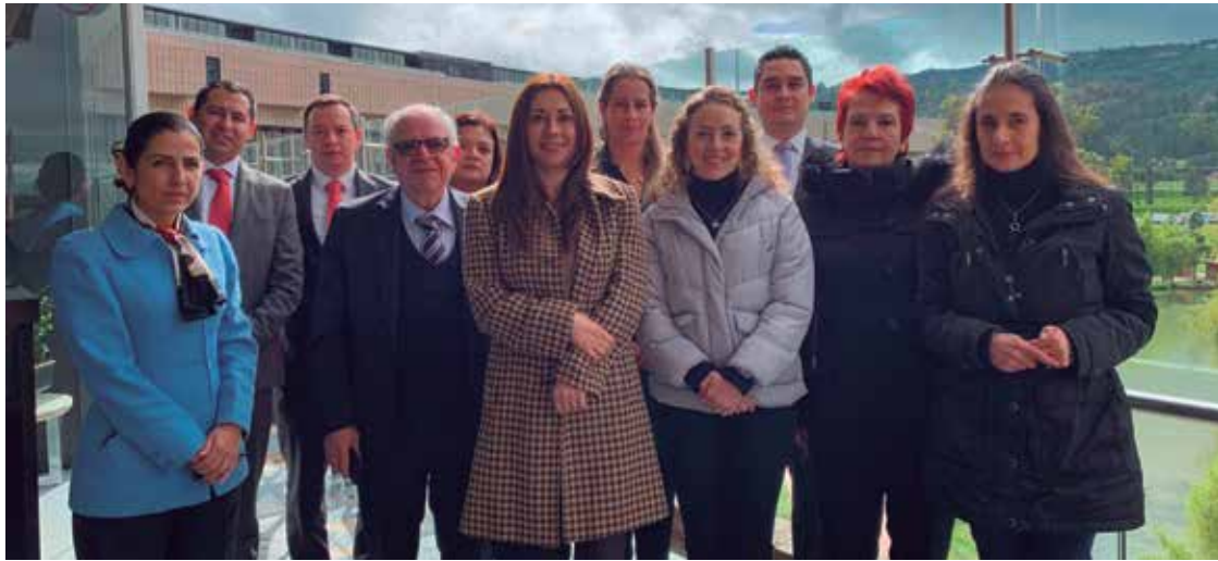
El equipo de profesores, asesores y jefes del Consultorio Jurídico - Centro de Conciliación de la Universidad de La Sabana.

E n este periodo 2019-2, 98 estudiantes del programa de Derecho iniciarán el primer acercamiento al ejercicio profesional en el Consultorio Jurídico - Centro de Conciliación y sus diferentes satélites, pasando los días de turno y atendiendo los casos de usuarios de escasos recursos que requieran asesoría legal gratuita, conforme a la Ley 583 del 2000, como abogados habilitados si bien aún no graduados.