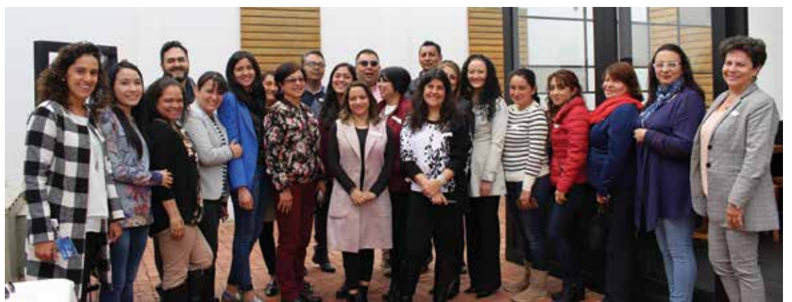
Coordinadores, orientadores y miembros del Centro de Servicios y la Facultad de Psicología participaron en el encuentro.

Articular a la comunidad con la academia es uno de los retos del