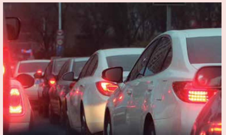
En el pilar de Infraestructura del Índice Global de Competitividad del Foro Económico Mundial 2017-2018, la nación ocupó el puesto 87 entre 137 países.

Por el bien del país, ojalá el denominado Pacto por el Transporte del Plan de Desarrollo lleve a que Colombia dé un salto de calidad y gane en competitividad, lo cual redundará en un mayor desarrollo económico.