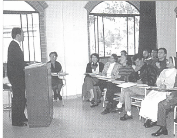
El compromiso debe guiar siempre la labor del educador.