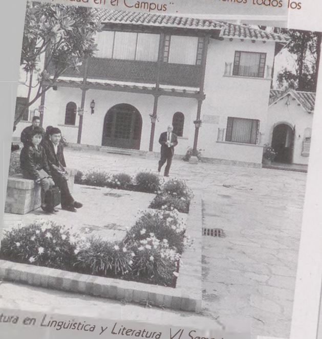
atura en Lingüística y Literatura VI Semestre.

En la Universidad es excelente además se complementa a. Lo que más me agrada es que tenemos todos los tranquilidad en el Campus".