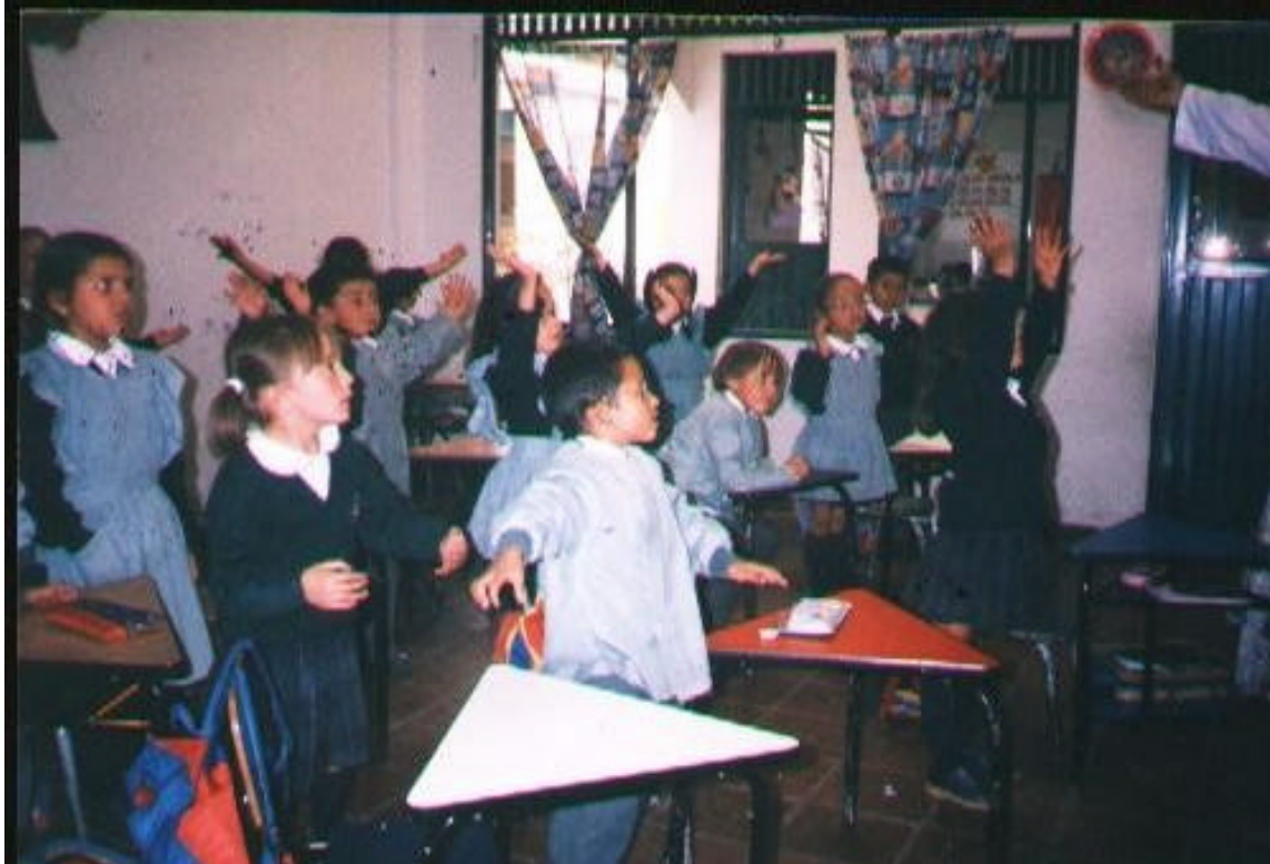
Foto No. 2 Grupo de Transición