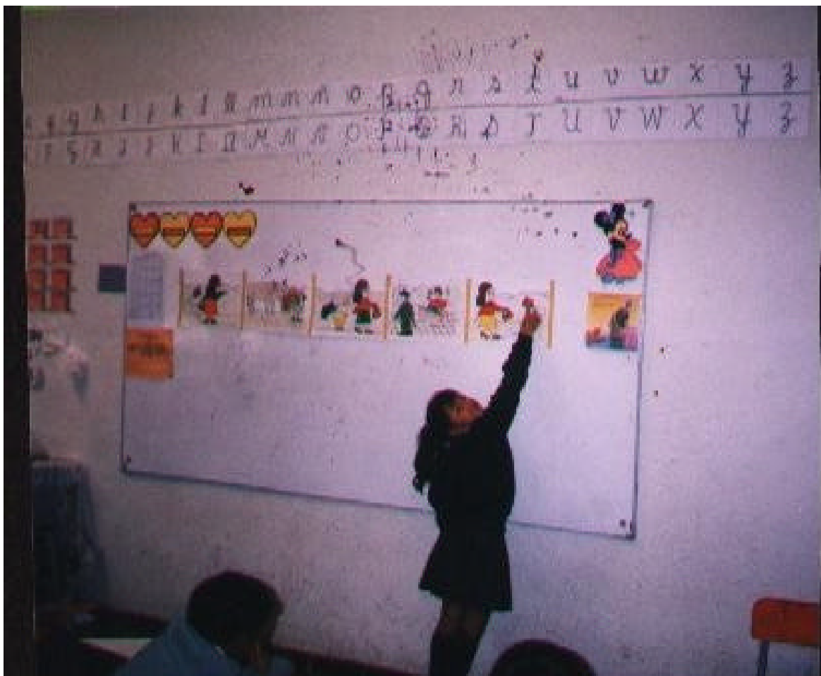
Foto No. 4 Descripción de un frizo