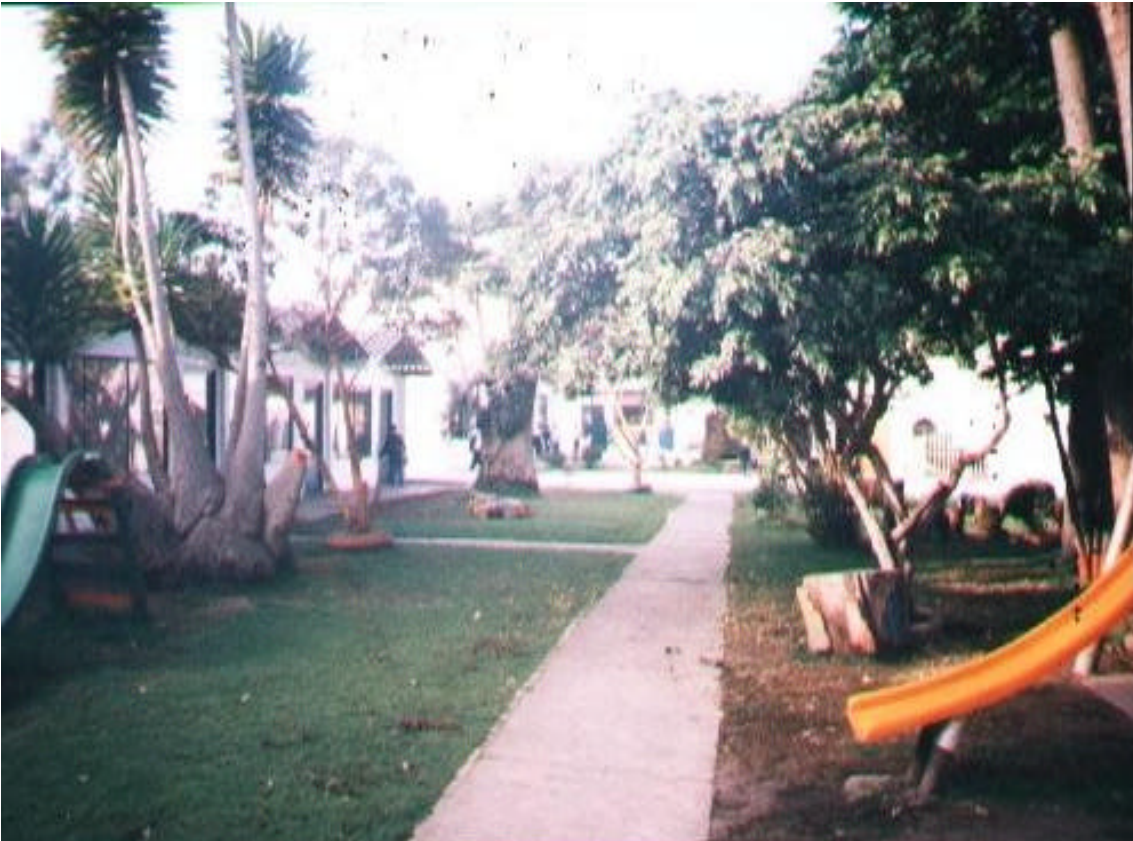
Foto No. 1 Gimnasio George Berkeley

El Gimnasio George Berkeley nace en 1985 como una idea que se va cristalizando el día 6 de febrero de 1986, sede que dispone de más de 6.500 metros cuadrados, cumple en este año 17 años de ser fundado. Los alumnos de preescolar y primaria además de ser orientados con