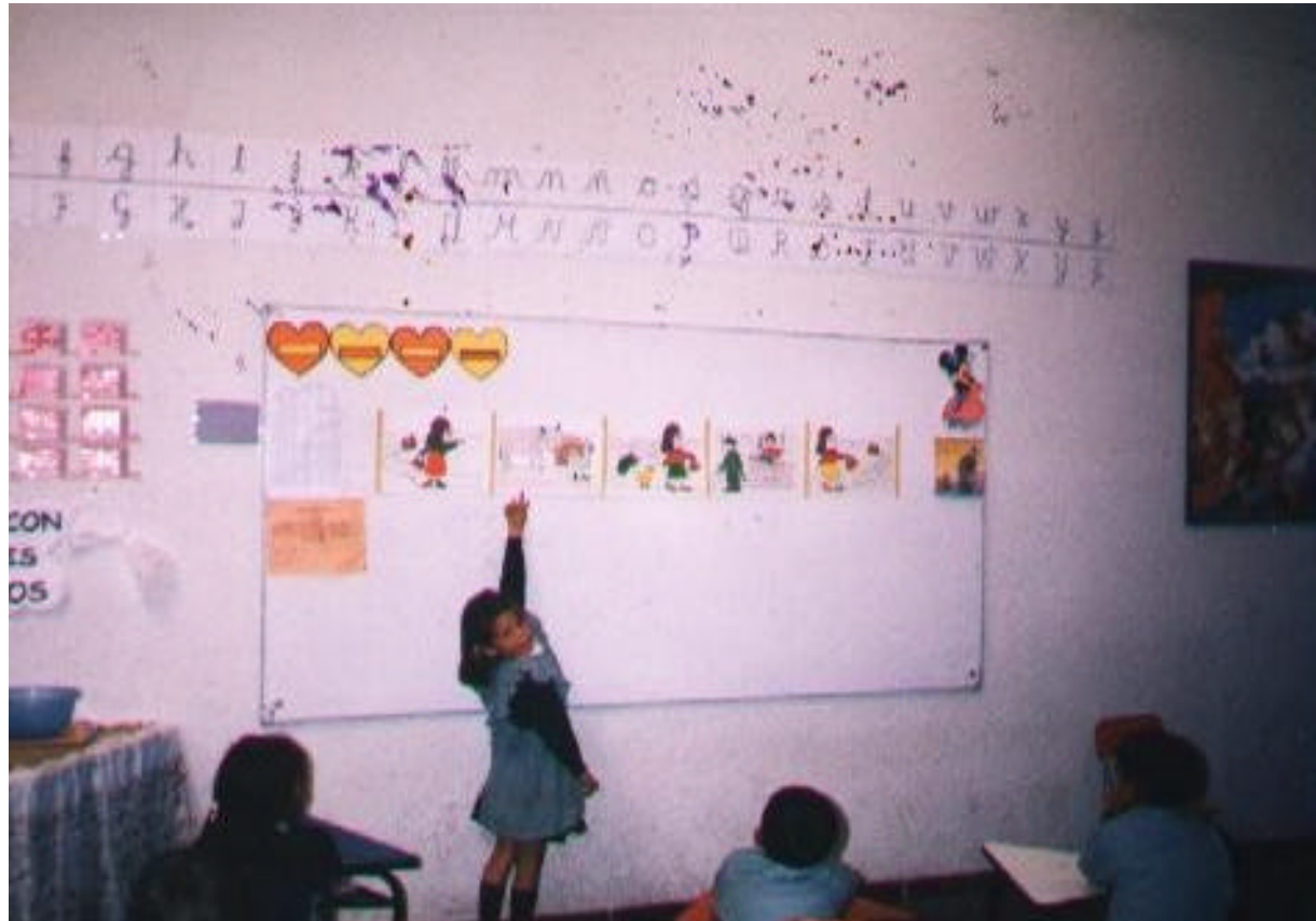
Foto No. 4 Descripción de láminas