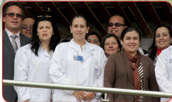
■ Equipo de la Clínica Universidad de La Sabana