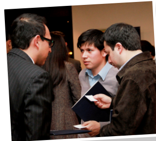
■ Intercambio de tarjetas entre graduados empresarios.

Más de 100 personas asistieron al evento que llenó las expectativas de los graduados, quienes intercambiaron tarjetas, presentaron sus empresas, servicios o productos. Al finalizar, felicitaron al equipo Alumni y dieron las gracias por darles esta oportunidad.