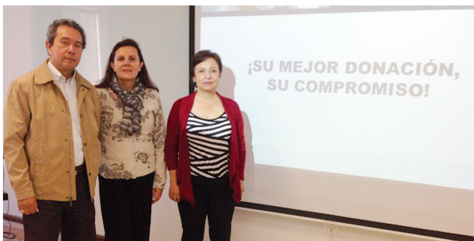
■ Padres de familia Asociación de Amigos

Como señal de gratitud y reconocimiento por las vinculaciones al programa Forjando Caminos, que lidera Amigos Unisabana, se hizo una reunión con algunos padres de familia, que con su aporte lo fortalecen para que se amplíen los recursos y por ende la cobertura de becarios.