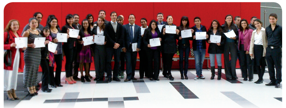
■ Delegación de Mosquera y equipo de la EICEA

El 10 y 11 de julio de 2013, se realizó la jornada de graduaciones del programa de Capacitaciones de Práctica Social de la EICEA. A la jornada asistieron delegaciones de Chía, Tocancipá, Gachancipá y Mosquera.