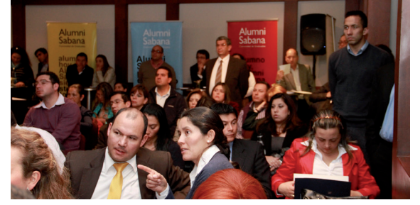
■ Durante la presentación de los beneficios de participar en una rueda de negocios.