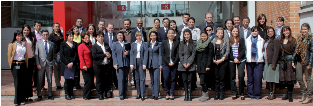
■ Líderes de Comunicación Universidad de La Sabana

El 17 de julio se llevó a cabo el Taller “El líder de Comunicación Unisabana: Gestor de Comunicación, Gestor de Cultura 2013-2”, liderado por la Dirección de Comunicación Institucional. Esta es la tercera versión del encuentro que reunió a los líderes de comunicación de cada Unidad académica y administrativa de la Universidad, Inalde, la Clínica Universidad de La Sabana y el Instituto de Postgrados-Forum.