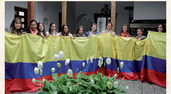
■ Esta será la bandera que viajará a la JMJ