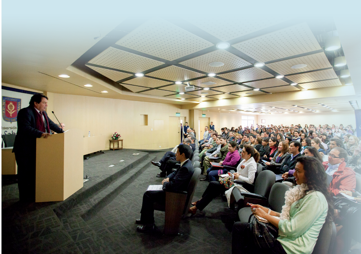
■ Encuentro de docentes del Distrito.