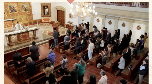
■ Misa de Envío

El grupo de jóvenes de la Universidad que asistirá a la JMJ participó en la celebración de la Misa de Envío que se llevó a cabo el martes 16 de julio. En la misma ceremonia se bendijo la bandera con los mensajes que el grupo de La Sabana llevará como obsequio para el Papa Francisco.