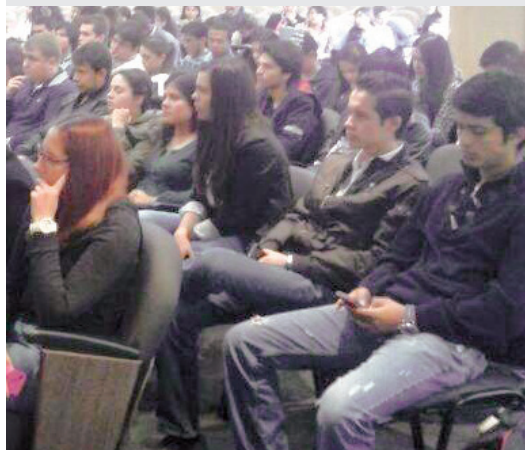
■ Durante la actividad de Cabildo Abierto.

Dentro de sus planes a futuro contempla realizar una especialización en Europa en Estrategias de comunicación en gestión.