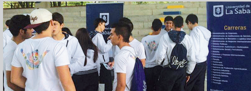
Estudiantes de los diferentes colegios de Ibagué

La Dirección de Admisiones de La Sabana visitó los días 28 y 29 de mayo a más de 774 estudiantes de los colegios Champagnat, Franciscano Jiménez de Cisneros, San Bonifacio de Las Lanzas, la Institución Educativa Ex alumnas La Presentación, el Colegio COMFENALCO y el Gimnasio Campesino, en la Feria que se realizó en Ibagué, en donde la Universidad presentó sus veintiún programas de pregrado.