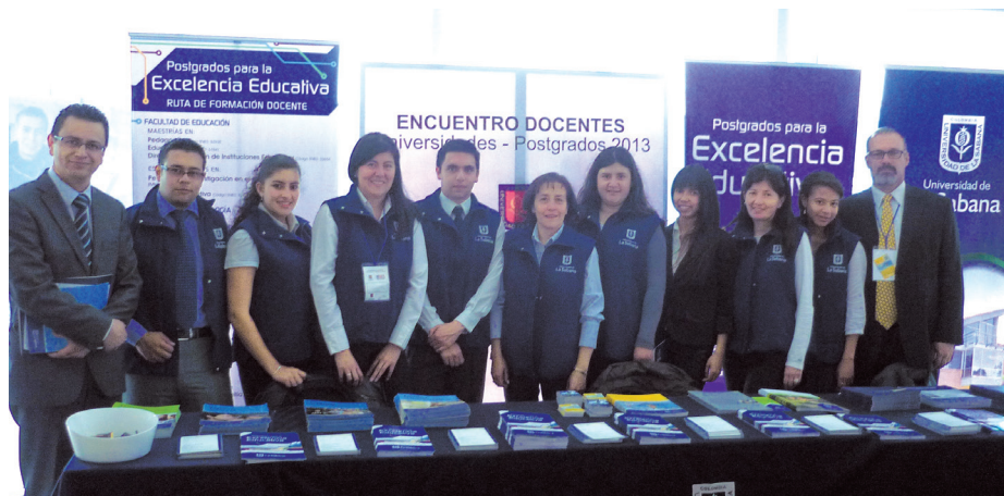
Asistentes al Encuentro de Docentes y Universidades de Posgrado - 2013.

Nuestra Universidad participó en dieciocho de los conversatorios organizados con la presencia de profesores y directores de los programas que conforman la oferta de posgrados relacionados con educación, que causaron interés en los docentes del distrito.