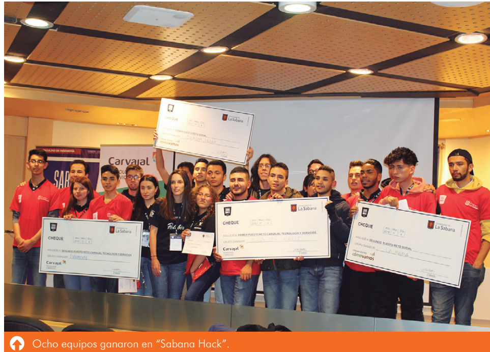
Ocho equipos ganaron en “Sabana Hack”.

Cada grupo contó con seis minutos para presentar su producto final de forma clara, mostrando las ventajas y oportunidades de su solución. Los jurados —directivos de las empresas— evaluaron cuatro aspectos: innovación e impacto de la solución, complejidad tecnológica, experiencia del usuario y presentación final.