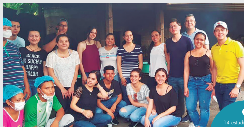
14 estudiantes de la EICEA participaron en la misión gastronómica al Valle del Sinú, organizada por el programa de Gastronomía.