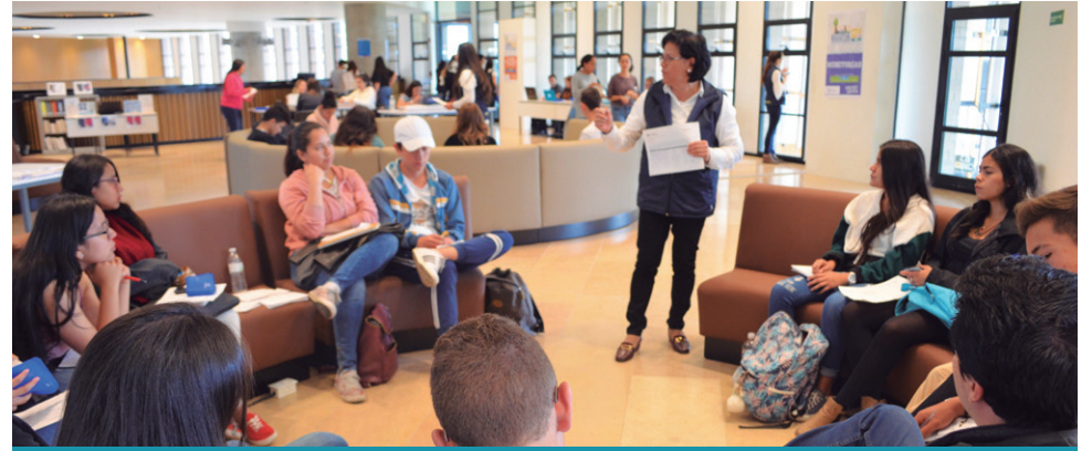
695 estudiantes aprovecharon los recursos académicos de la Dirección Central de Estudiantes para preparar de la mejor manera los exámenes finales del semestre 2018-2.