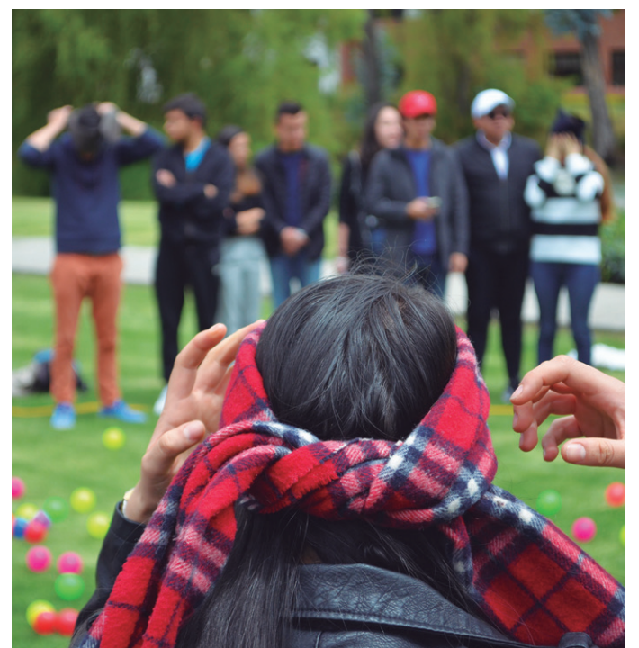
Los estudiantes del Programa de Tutoría para Becarios y los líderes de los grupos de estudio disfrutaron de la jornada universitaria "Geniosidad" puesta al servicio".

Durante el almuerzo, los participantes disfrutaron de presentaciones de Las Botas del Gato, el grupo de teatro de La Sabana. Luego de los cuentos e improvisadores, los estudiantes se dirigieron a la segunda parte de la jornada en compañía de los miembros de Puro Love. Con ellos vivieron actividades de aprendizaje experiencial y al