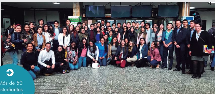
Más de 50 estudiantes asistieron a la actividad.