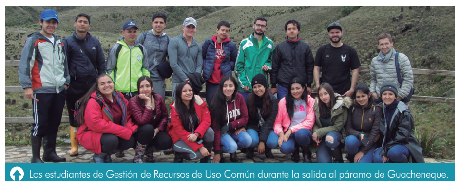
Los estudiantes de Gestión de Recursos de Uso Común durante la salida al páramo de Guacheneque.