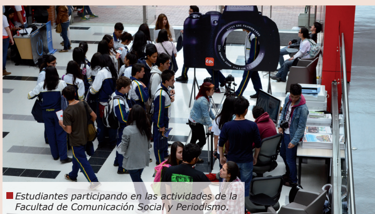
Estudiantes participando en las actividades de la Facultad de Comunicación Social y Periodismo.

La Dirección de Admisiones de la Universidad de La Sabana y los veintinueve programas de pregrado realizaron, el 9 y 10 de mayo, el evento Open Campus 2013, en el que 2714 estudiantes de los últimos grados de los diferentes colegios de Bogotá visitaron nuestro campus universitario.