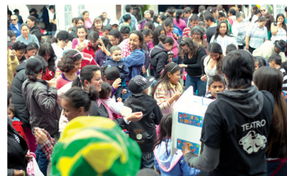
Participantes de Misión Sabana 2013- I Chía.