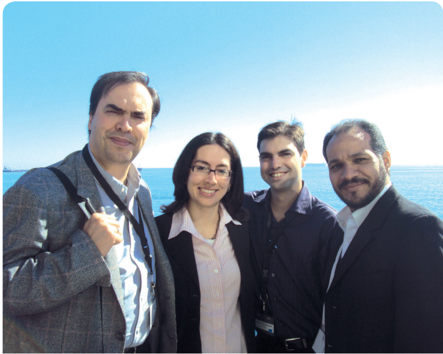
Grupo de investigación de Empresa Familiar de INALDE.