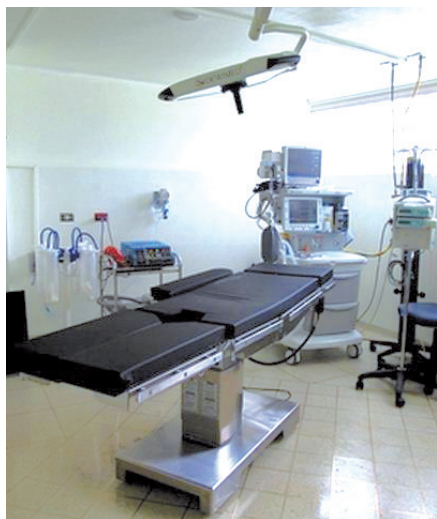
■ Nuevos equipos de Cirugía en la Clínica Universidad de La Sabana.

Desde enero de 2013 hemos visto el ingreso progresivo de nuevos equipos dentro de los cuales destacamos nuevas máquinas de anestesia con monitores de última generación, encargados de medir de manera