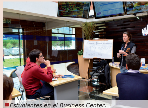
Estudiantes en el Business Center.