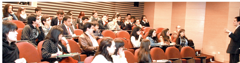
■ Estudiantes de diferentes colegios de Bogotá y del programa de Filosofía en la última Conferencia.