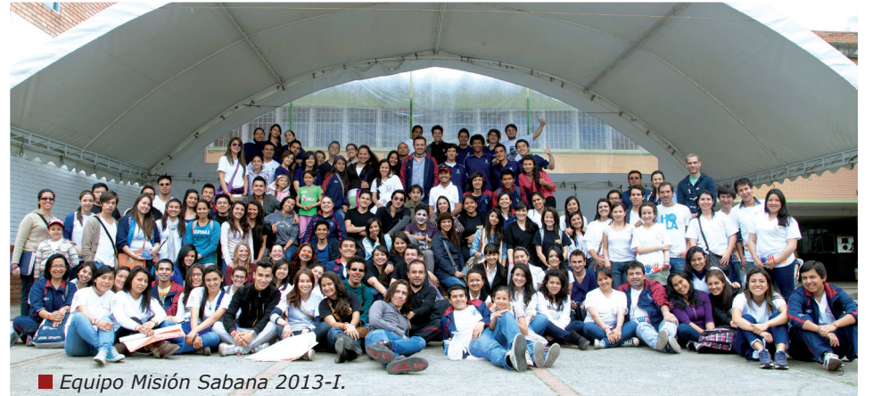
Equipo Misión Sabana 2013-I.

En el transcurso de la actividad se beneficiaron más de 1.500 personas del sector.