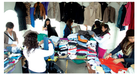
Actividad del ropero, que se hizo durante la jornada.