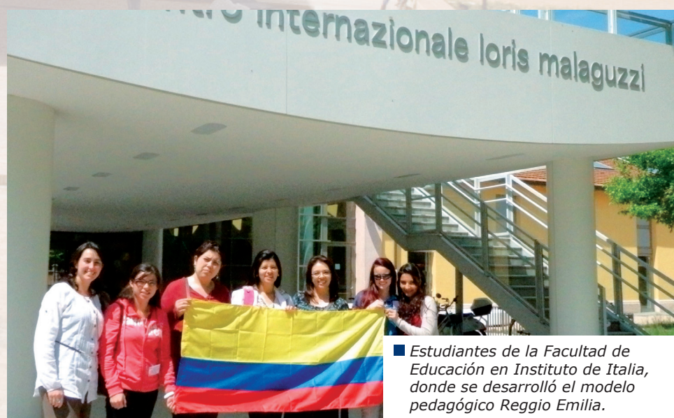
Estudiantes de la Facultad de Educación en Instituto de Italia, donde se desarrolló el modelo pedagógico Reggio Emilia.

Cinco estudiantes de la Facultad de Educación realizaron un viaje a Venecia, Italia, con el propósito de participar en el Congreso Study Group 2013 y con esto conocer de primera mano el modelo pedagógico Reggio Emilia o Reggiano, llamado así por tener origen en el pueblo italiano Reg-