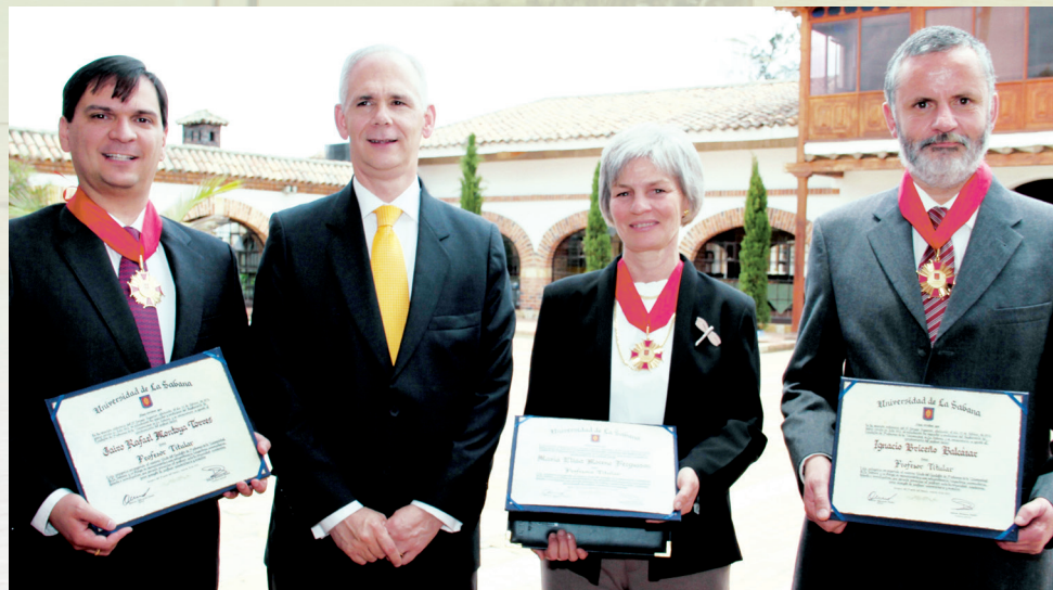
■ El Rector junto a los nuevos Profesores Titulares.

El Profesor titular se destaca por su trayectoria académica y su compromiso no solo con la docencia, sino con la comunidad universitaria; a través de su labor docente e investigativa fortalece los programas académicos de la Universidad y comparte con los estudiantes conocimientos que les permitirán desempeñarse como profesionales integrales en el ámbito laboral.