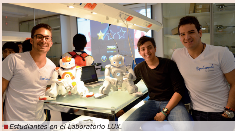
Estudiantes en el Laboratorio LUX.