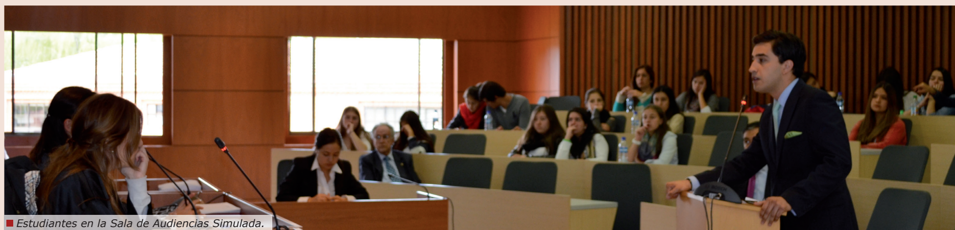
Estudiantes en la Sala de Audiencias Simulada.