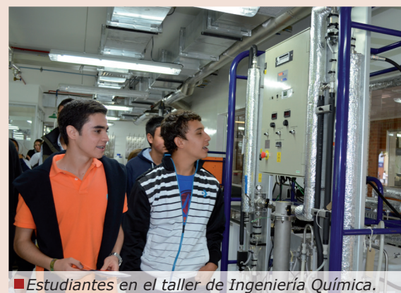
Estudiantes en el taller de Ingeniería Química.