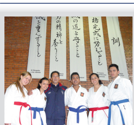
Selección Karate de la Universidad de La Sabana.