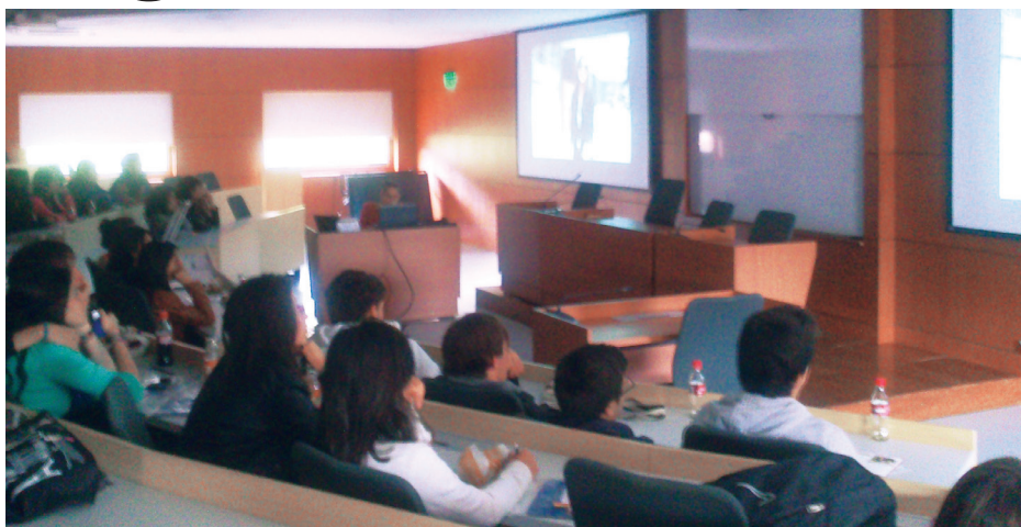
■ Participantes del taller "Abogado por un día".

Las facultades de Derecho y Ciencias Políticas, Comunicación, la Escuela Internacional de Ciencias Económicas y Administrativas, y el programa de Gastronomía llevaron a cabo los diferentes talleres teórico-prácticos con el fin de que los estudiantes interesados conocieran a fondo sus programas, las ventajas y los servicios de nuestro campus universitario.