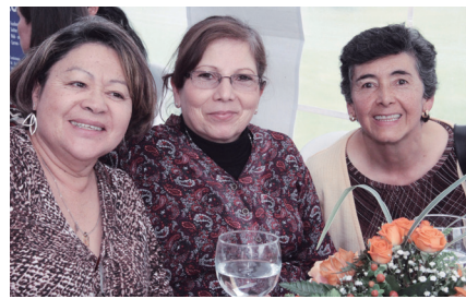
■ Graduas de la Facultad de Educación durante el almuerzo de confraternidad ofrecido por Alumni Sabana.