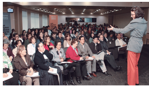
■ Graduados durante la conferencia "Una mirada nueva para construir entornos de confianza".

Durante la Jornada, los estudiantes de la comunidad universitaria tuvieron la oportunidad de tener un contacto directo con cada una de las empresas y agencias para obtener información desde sus representantes y conocer acerca de las oportunidades y programas para su desarrollo profesional.