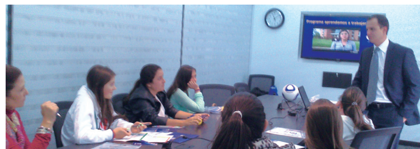
■ Estudiantes del Colegio Lisa Meitner, el Colegio Hijas de Cristo Rey, el Gimnasio de los Llanos, el Colegio Nueva Inglaterra, el Colegio Santo Tomás de Chía y el Gimnasio La Fragua.