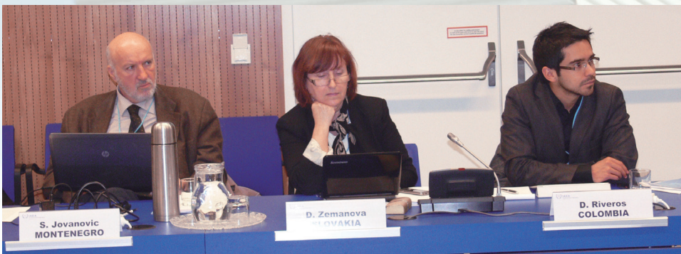
Conferencia Mundial sobre comunicación en temas nucleares.

En las últimas décadas ha crecido la conciencia social sobre la necesidad de tener una comunicación más eficaz y la consulta con las partes interesadas sobre el tema nuclear y de seguridad radiológica.