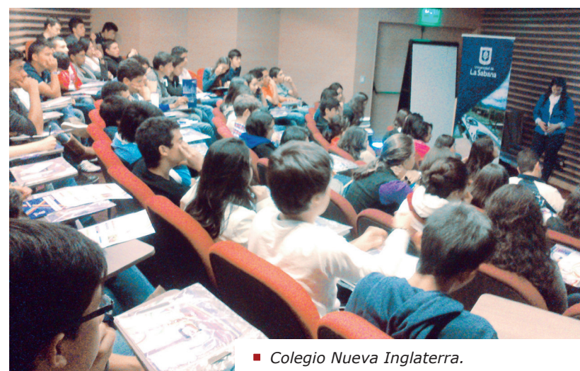
■ Colegio Nueva Inglaterra.