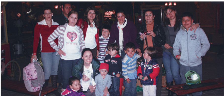
■ Participantes de la celebración del Día del Niño.

Para imprimir solo necesitas enviar el documento al correo puntopago@unisabana.edu.co .