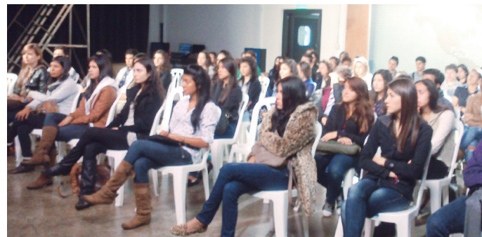
■ Aspirantes a los diferentes programas durante la actividad del taller teórico - práctico.

El 18 de abril se realizó el "Taller de análisis sensorial" del programa de Gastronomía en donde los estudiantes por medio de sus sentidos degustaron los alimentos, identificando los sabores básicos. Igualmente, los aspirantes tuvieron la oportunidad de conocer de cerca los testimonios y experiencia de