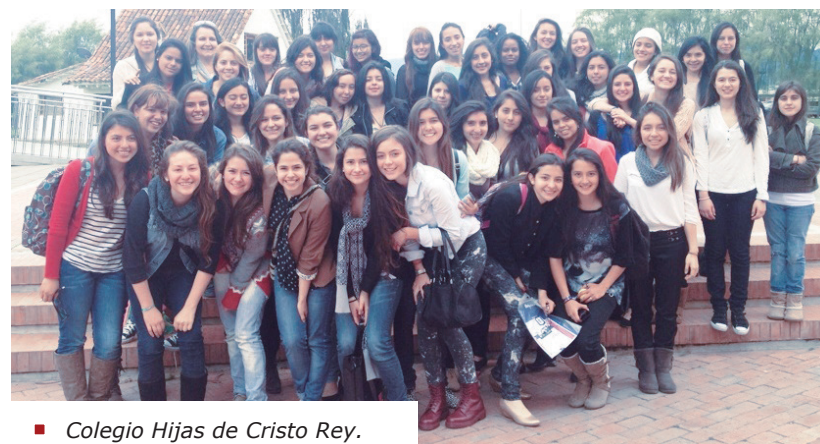
■ Colegio Hijas de Cristo Rey.