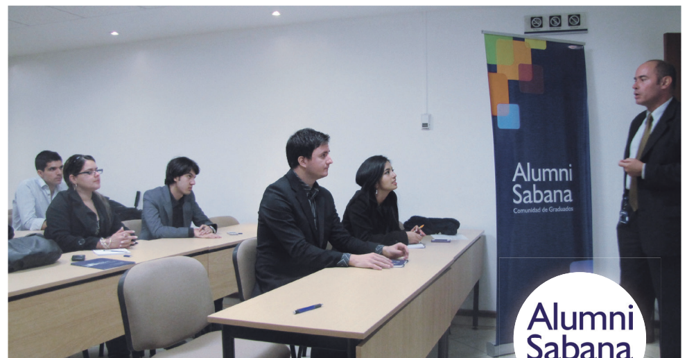
■ Algunos de los graduados que asistieron, durante la charla de la empresa BT Latam.

Los asistentes quedaron entusiasmados pues ven que cumplen con los requisitos, es decir, son bilingües, con capacidad de liderazgo, creatividad, entusiasmo y comunicación. Además, porque el programa contempla una capacitación que inicia en la sede central en Reino Unido, formación en liderazgo, mientras rotan, durante los dos años que dura el programa, por diferentes áreas de la empresa.