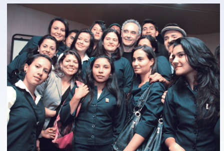
■ Estudiantes del ICSEF junto a Ferran Adrià durante la conferencia de innovación y creatividad.

Con el fin de participar en la conferencia programada por Telefónica y La Sabana con Ferran Adrià, catorce estudiantes, dos profesores del área de cocina básica y las directivas del Instituto Superior de Ciencias Sociales y Económico Familiares —ICSEF— visitaron la Universidad el 11 de abril.