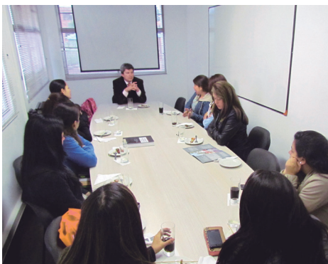
■ Durante la actividad "Café con Decano" con estudiantes de la Especialización en Psicología Educativa.