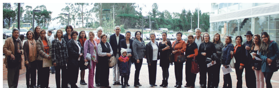
■ Grupo de asistentes a la tercera charla de Formación de Vivienda Sabana.

El Programa Vivienda Sabana realizó su Tercera Charla de Formación para las personas que tienen sus viviendas inscritas en el programa y alojan a los estudiantes foráneos de la Universidad.