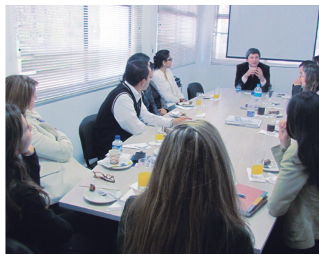
■ Durante la actividad "Café con Decano" con estudiantes de la Especialización en Psicología Clínica de la Niñez y de la Adolescencia.