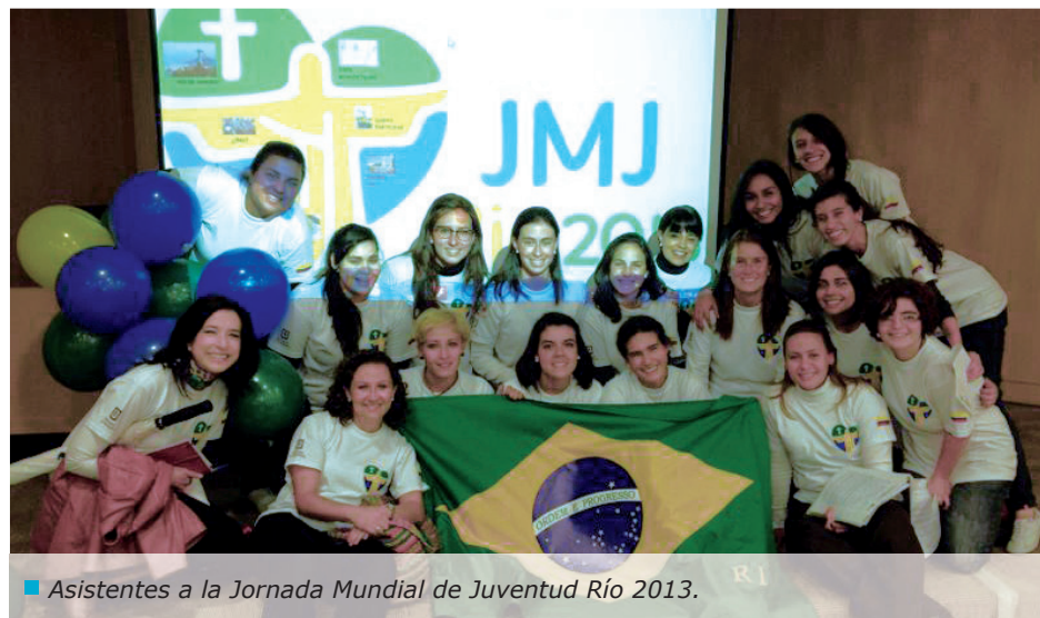
■ Asistentes a la Jornada Mundial de Juventud Río 2013.