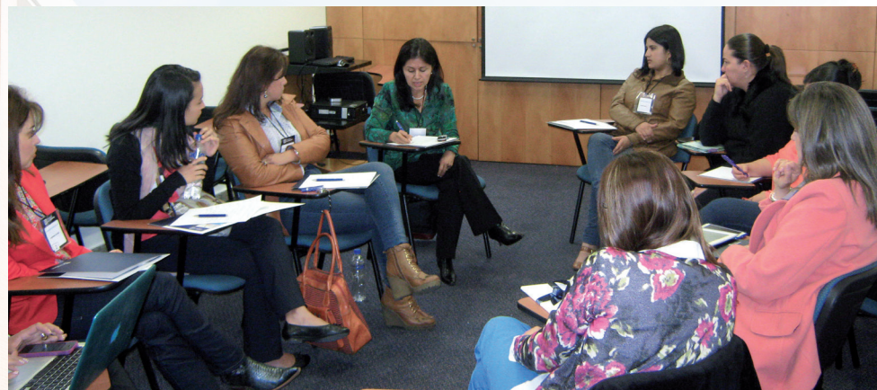
■ Asistentes al primer conversatorio pre-congreso de Nutrición Pediátrica.

Desde la academia se contó con la participación de representantes de las universidades de Antioquia, del Valle, El Bosque,