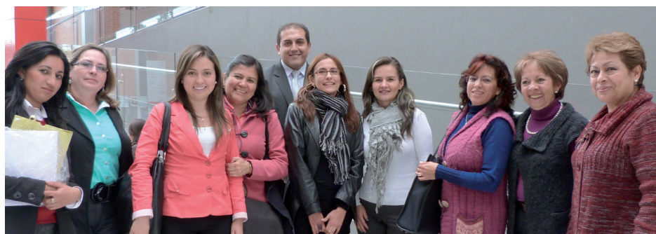
■ Integrantes del proyecto de la Secretaría de Educación