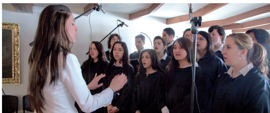
■ Ensayo del Coro de la Universidad.

El Coro de la Universidad nos representará en la Catedral de Villavicencio el sábado 30 de marzo en el cierre de la Semana Santa y vísperas de la resurrección de Jesucristo.