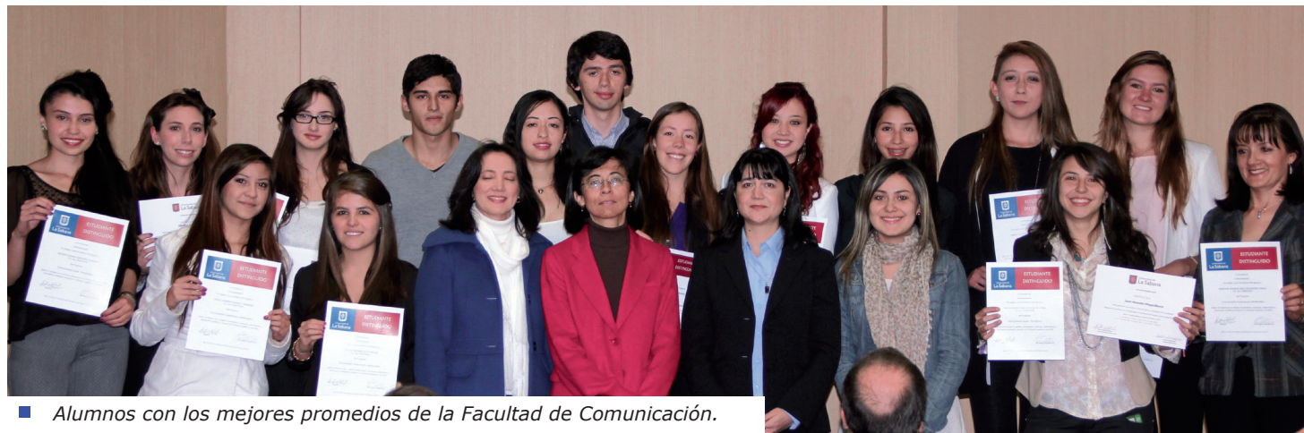
■ Alumnos con los mejores promedios de la Facultad de Comunicación.