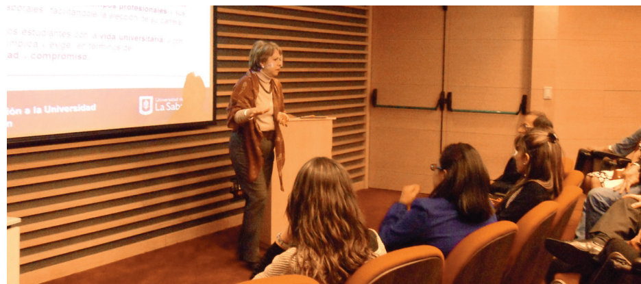
■ Padres de familia asistentes a la reunión.

El Programa de Integración a la Universidad —PIU—, ofrecido por la Facultad de Educación, es de carácter académico y busca orientar a los jóvenes que no han ingresado a la universidad por diversas razones y a aquellos que, luego de comenzar un proyecto de educación superior, se sienten desorientados.