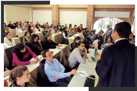
■ Participantes de la conferencia.

Como consecuencia del reto que ha significado para la Facultad de Psicología el tema de las prácticas, la Jefatura de Prácticas llevó a cabo el martes 5 de marzo la conferencia: “El Modelo del Marco Lógico: una herramienta para formulación de proyectos de intervención social”, orientada a fortalecer la formación investigativa del estudiante, dada la responsabilidad con la formación de profesionales íntegros con una sólida fundamentación disciplinar, sentido ético y transparencia.