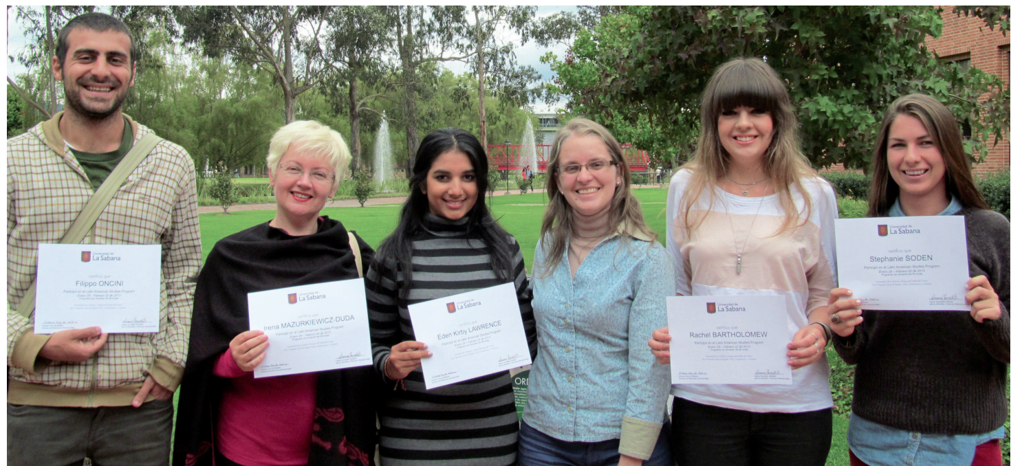
■ Asistentes al Latin American Studies Program.

El 23 de febrero finalizó el Latin American Studies Program —LASP—, de la Dirección de Relaciones Internacionales, al cual asistieron estudiantes de Queensland University of Technology (Australia), y de la Università Cattolica de Sacro Cuore (Italia).