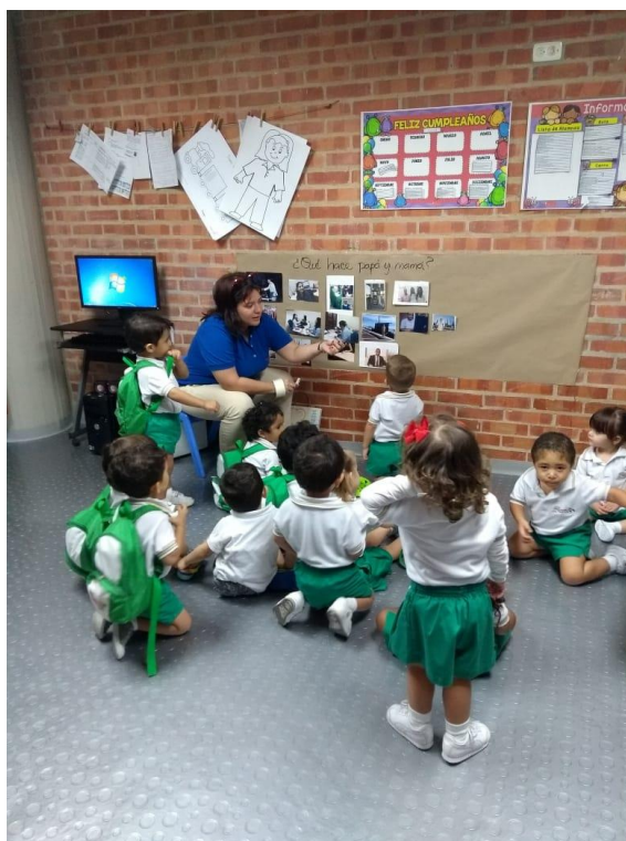
Figura XIX . Observación de clase 1