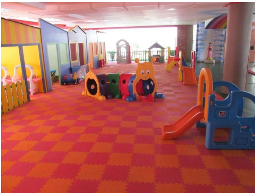
Figura V Zona de juegos interior