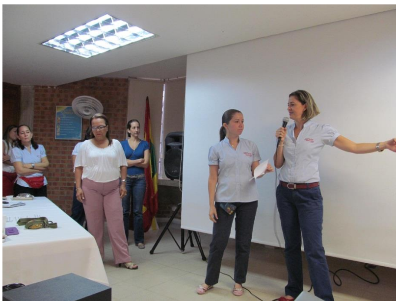
Figura IX Módulo I-Sesión 2: Características e indicadores del enfoque pedagógico desarrollista