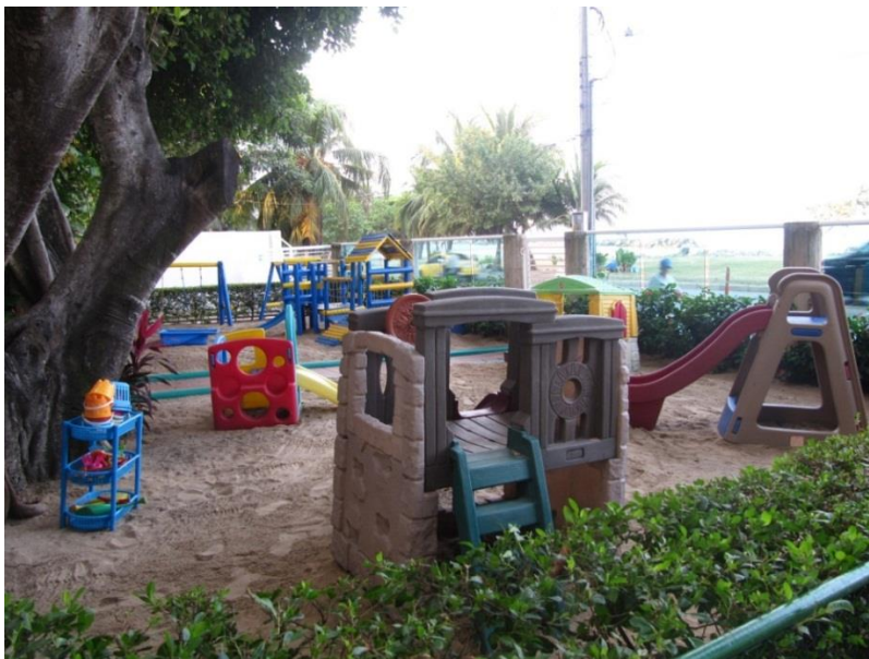
Figura II Zona de juegos exterior