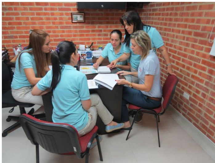
Figura XXI. Revisión de planeación a cargo de coordinación académica