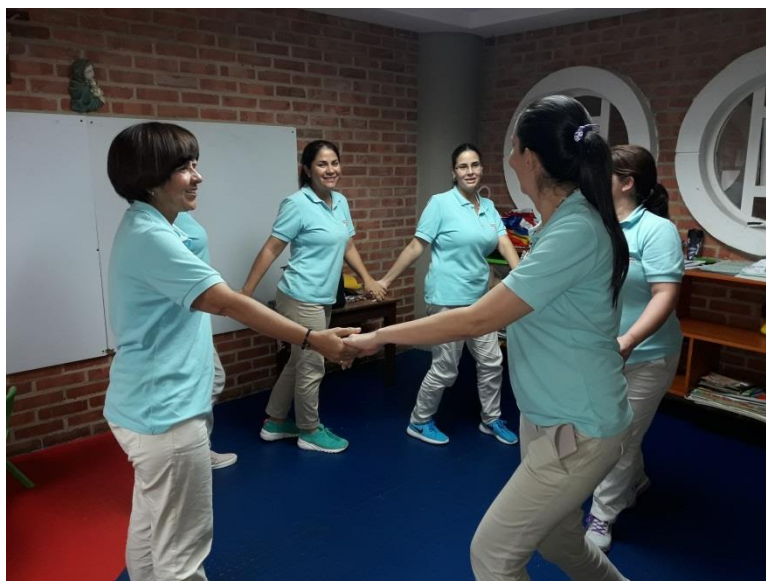
Figura XIV . Módulo II-Sesión 3: Dirección de otros