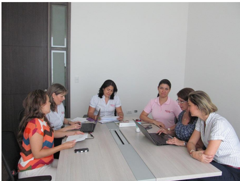
Figura X. Módulo I-Sesión 3: Revisión de nuestras prácticas en aula.