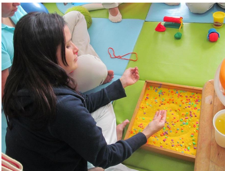
Figura XV . Módulo-II sesión 4: Aprendizaje continuo