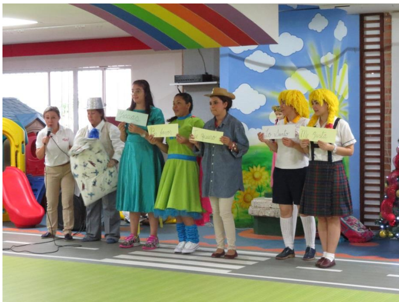
Figura VIII Módulo I-Sesión 1: Orígenes y principales exponentes