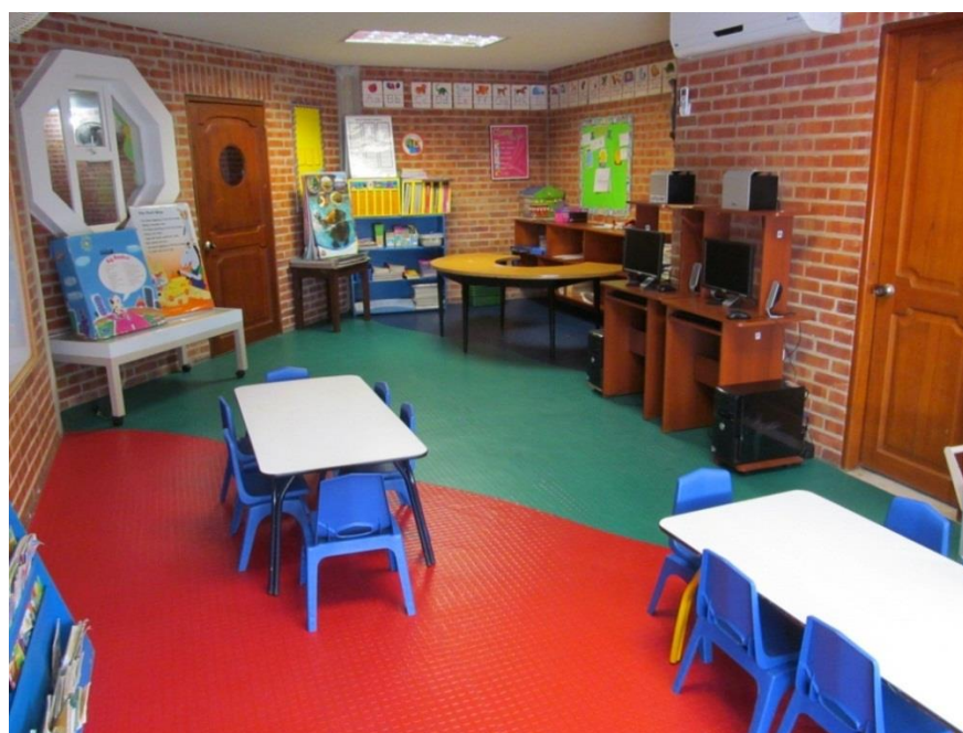
Figura IV Aula de clases.