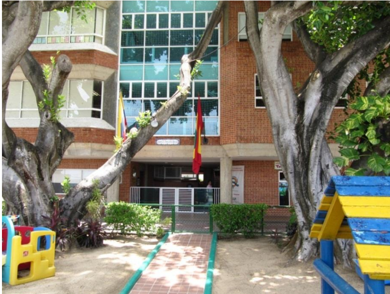
Figura I Centro de Educación Infantil Pepe Grillo Alborada, Biligüe