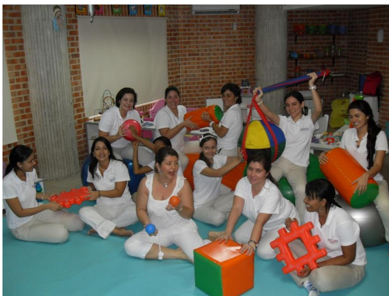
Figura XI. Módulo II-Sesión 1: Orientación a resultados