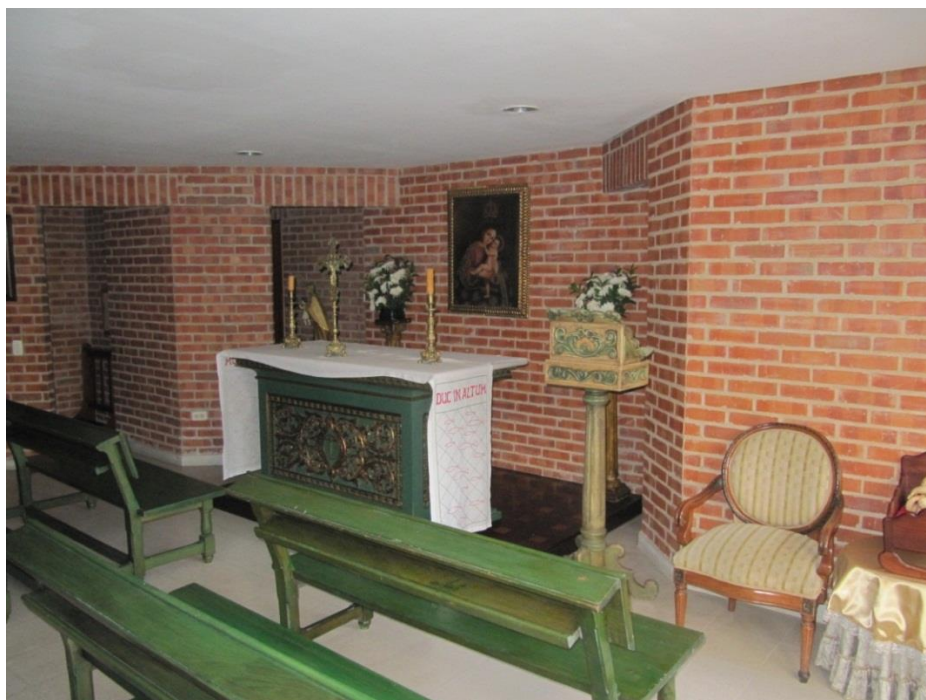
Figura VII Oratorio