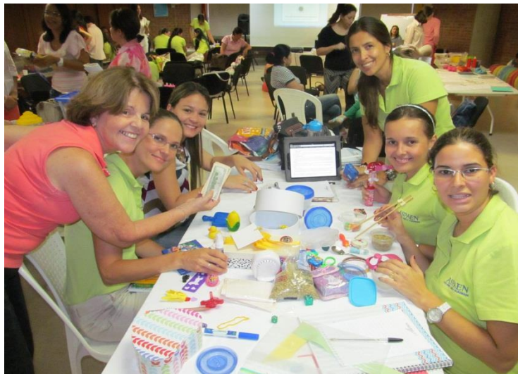
Figura XII . Módulo II-Sesión 1: Orientación a resultados