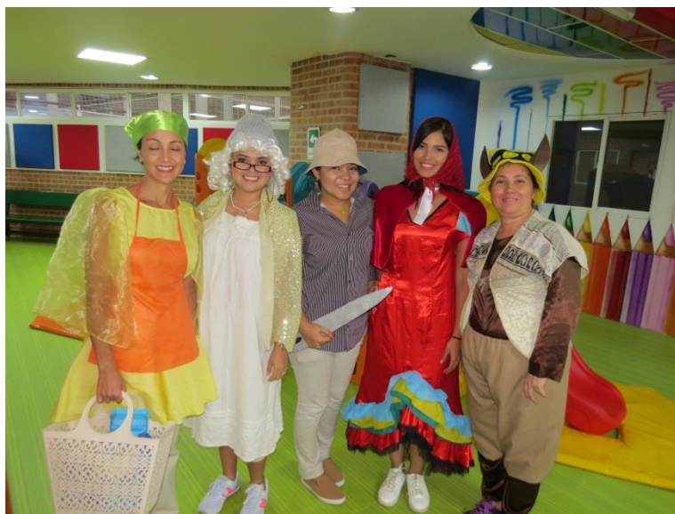
Figura XVII . Módulo III-Sesión 2: Los proyectos de aula de cada grupo