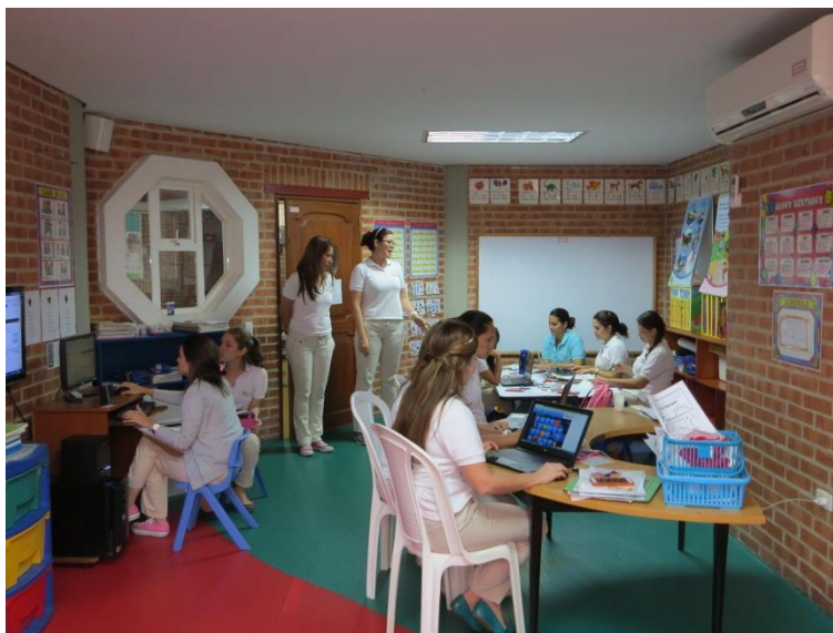
Figura XVIII . Módulo III-Sesión 3: Plan de ajustes.