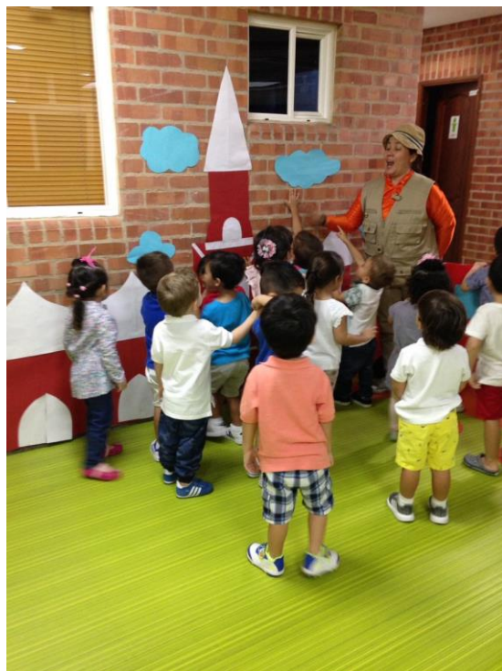
Figura XX. Observación de clase 2