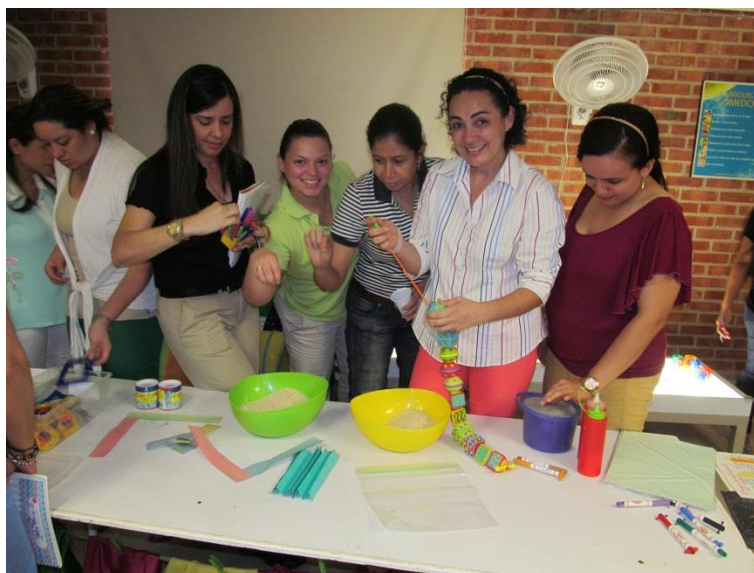
Figura XIII . Módulo-II Sesión 2: Resolución de problemas