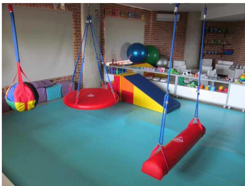
Figura VI Gimnasio.