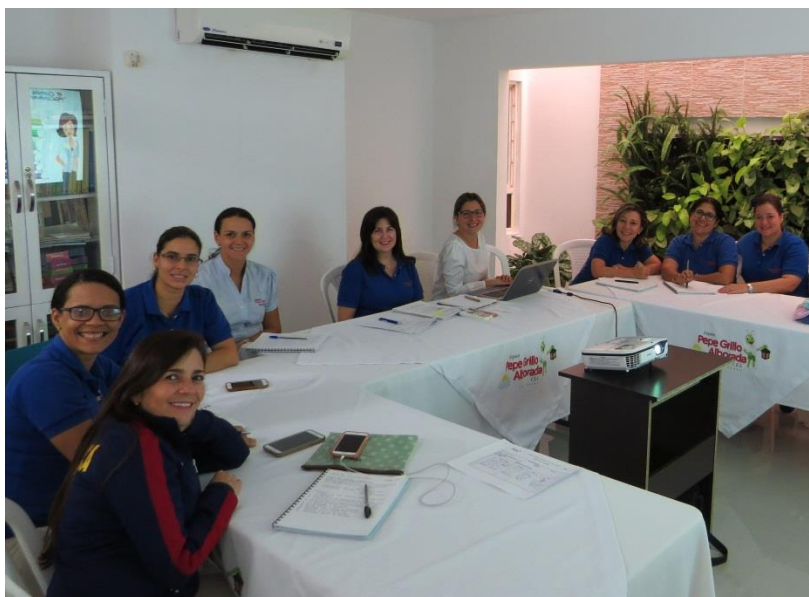
Figura XVI . Módulo III-Sesión 1: Los contenidos educativos ASPAEN para preescolar