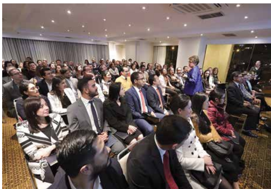
117 graduados de la Facultad de Medicina participaron en el “Encuentro Alumni Sabana”.