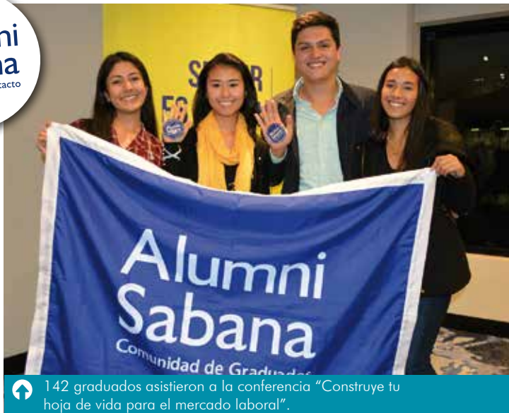
142 graduados asistieron a la conferencia “Construye tu hoja de vida para el mercado laboral”.