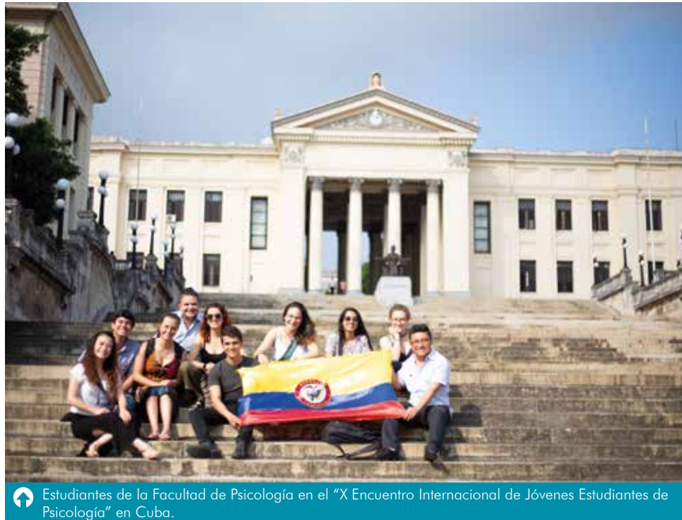
Estudiantes de la Facultad de Psicología en el “X Encuentro Internacional de Jóvenes Estudiantes de Psicología” en Cuba.