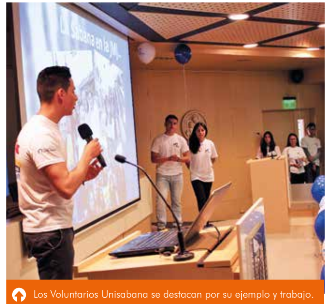
Los Voluntarios Unisabana se destacan por su ejemplo y trabajo.

La “JMJ Panamá 2019”, que tiene como lema “He aquí la esclava del Señor. Hágase en mí según tu palabra” (Lc, 1-38), será la edición número 34 del evento y la tercera en la que estará el Papa Francisco, tras la de Río de Janeiro (Brasil) del 2013 y la de Cracovia (Polonia) del 2016.