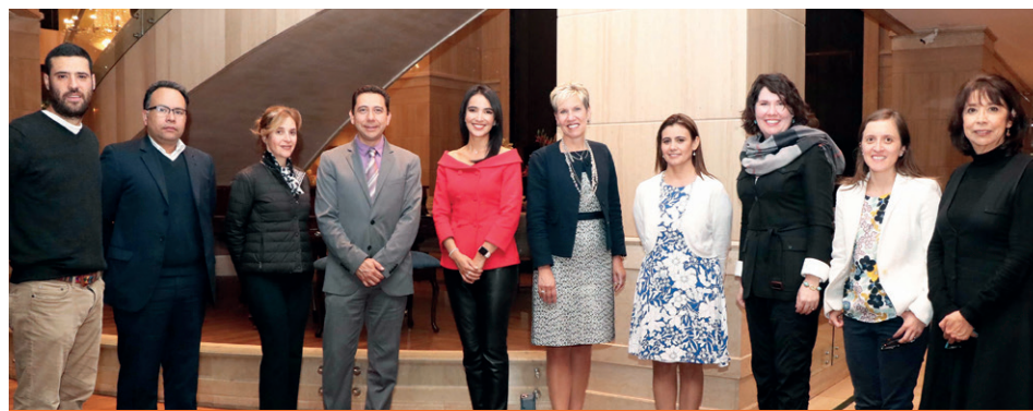
En el marco de la renovación del convenio, las directivas del Carter Center y los responsables del proyecto en La Sabana compartieron con algunos de los becarios.