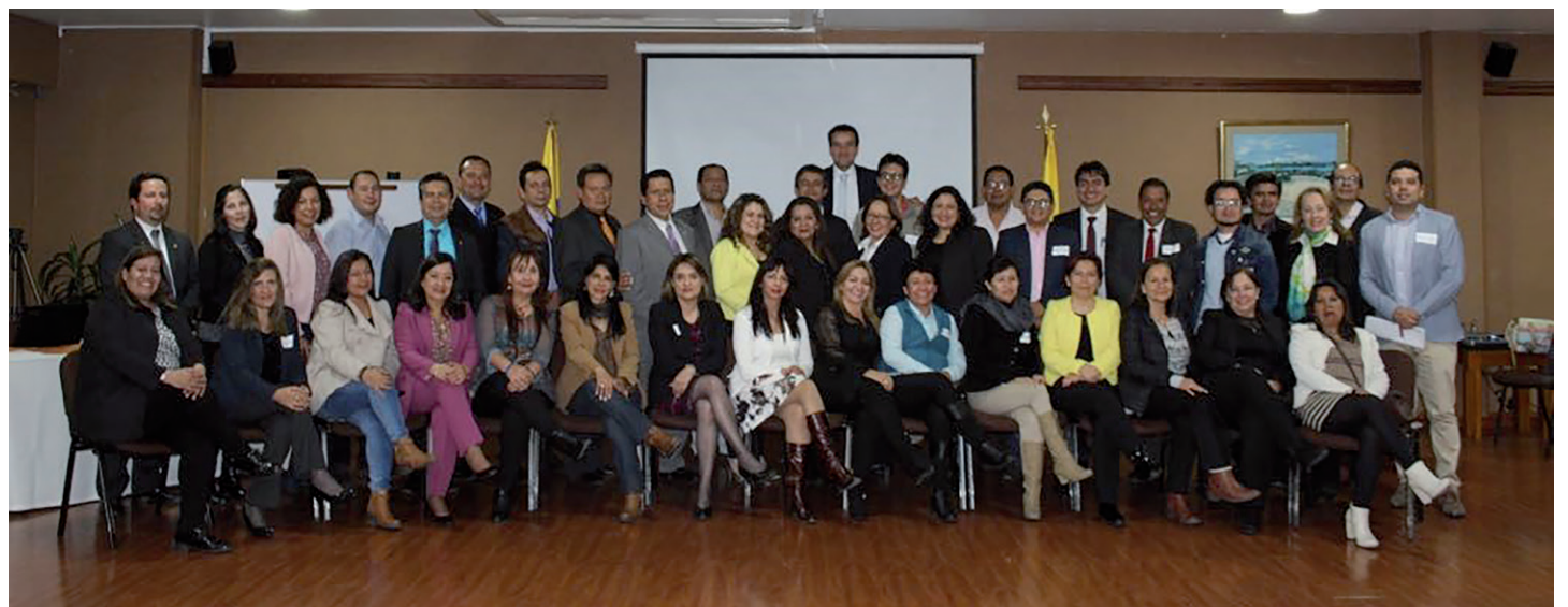
↑ Graduados, profesores y estudiantes de la Maestría en Dirección y Gestión de Instituciones Educativas al finalizar la jornada de actualización.

Para afrontar efectivamente una crisis es fundamental actuar en sus tres etapas: la precrisis, que se da cuando se evalúa si puede evitarse o no la situación; el manejo