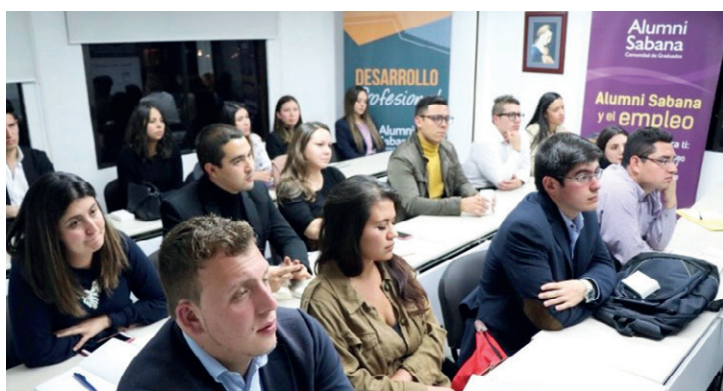
19 graduados se encontraron con un equipo de trabajo de la empresa Oracle.

El 28 de mayo, 19 de nuestros Alumni Sabana se encontraron con un equipo de trabajo de Oracle, compañía especializada en el desarrollo de soluciones de nube y locales, cuya sede principal está en Redwood City (California, Estados Unidos).