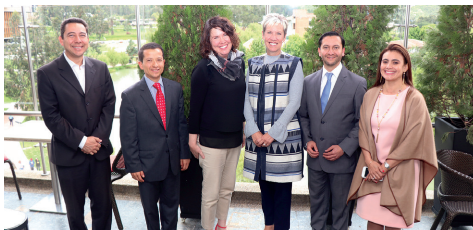
Los directivos de la Universidad de La Sabana y del Carter Center plantearon nuevas metas a futuro, entre otros, para fortalecer la investigación y la docencia en el marco del convenio.

exitoso que es y le ha dado el impacto que tiene en la sociedad”.