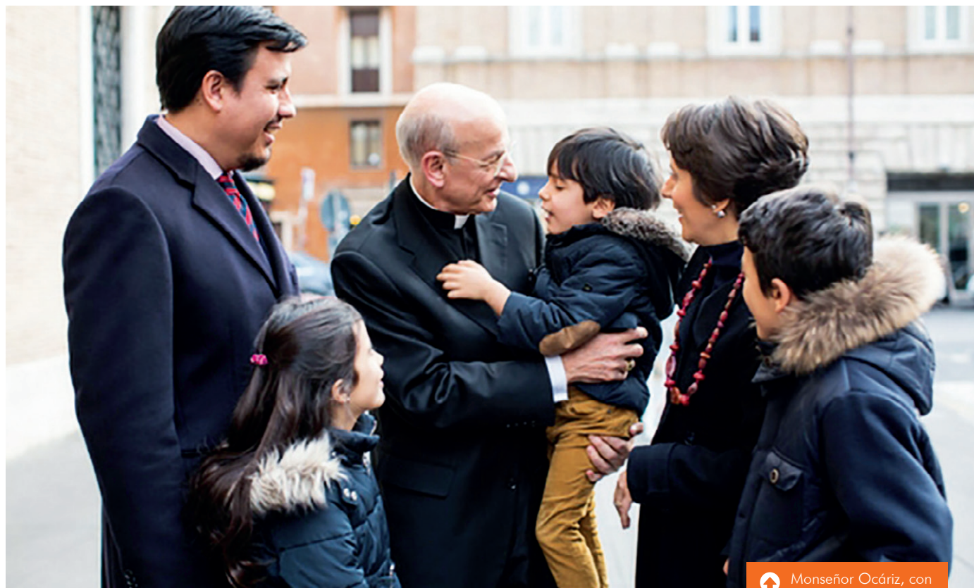
Monseñor Ocariz, con una familia en Roma.

Espero que no; fácilmente me daría cuenta y el partido perdería interés.