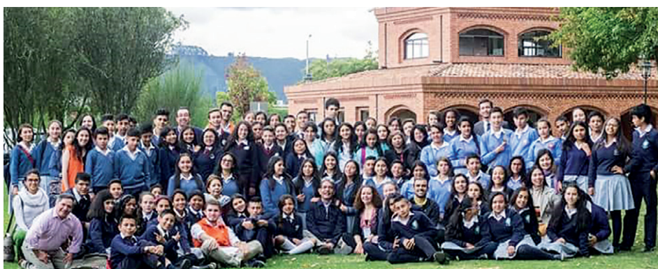
Al encuentro asistieron estudiantes y profesores de siete colegios oficiales de Cajicá, quienes compartieron una jornada de trabajo de seis horas en el campus.