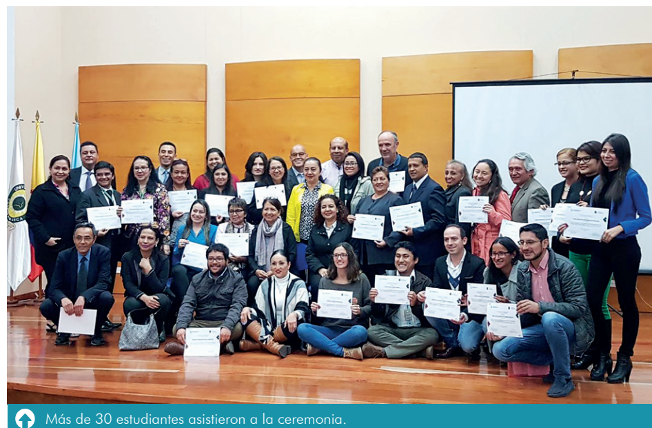
Más de 30 estudiantes asistieron a la ceremonia.