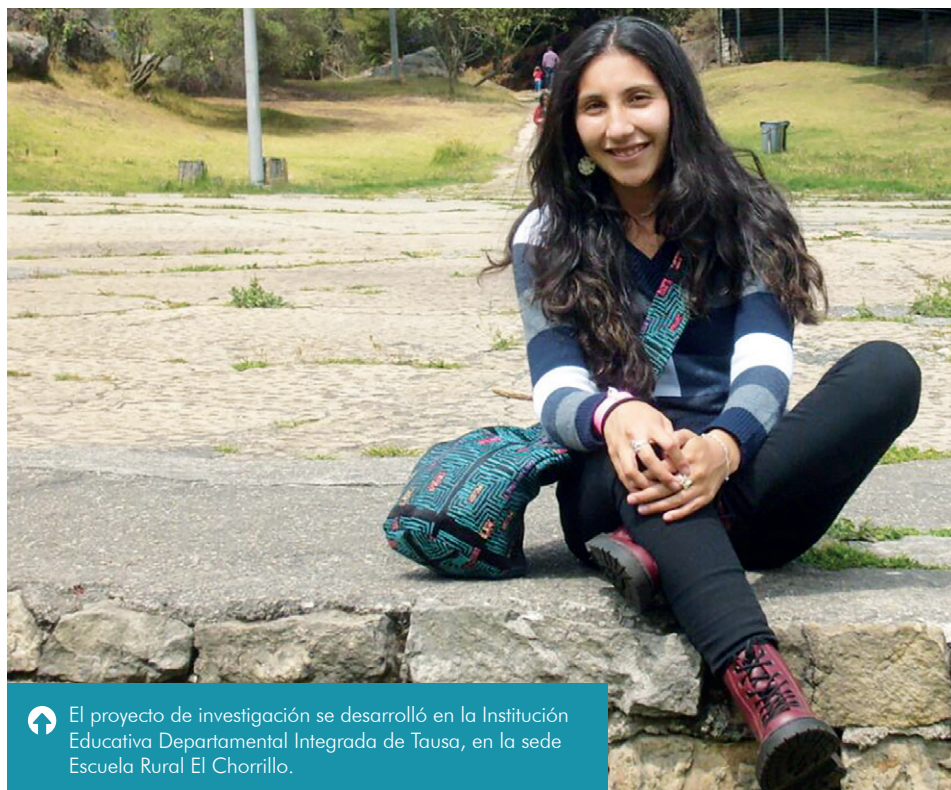
El proyecto de investigación se desarrolló en la Institución Educativa Departamental Integrada de Tausa, en la sede Escuela Rural El Chorrillo.