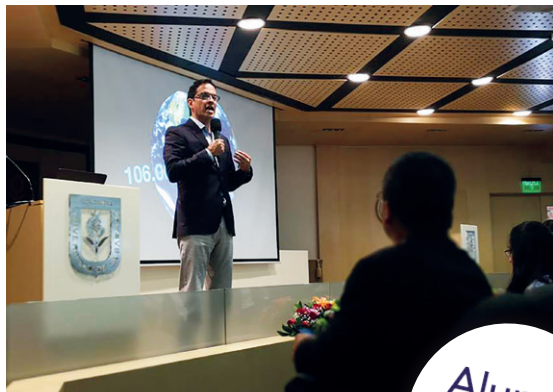
Actualmente, la Facultad de Medicina cuenta con más de 1.000 graduados de pregrado y 300 de posgrado de las diferentes áreas.