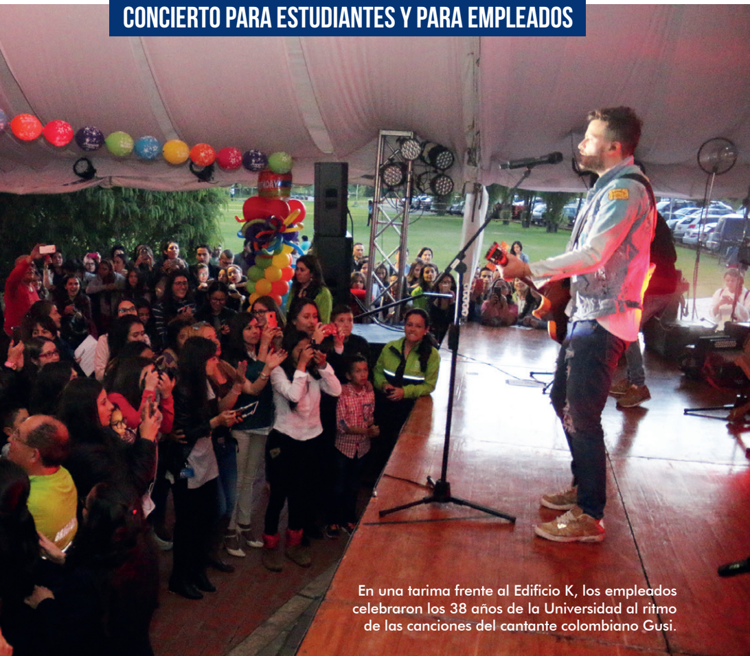
En una tarima frente al Edificio K, los empleados celebraron los 38 años de la Universidad al ritmo de las canciones del cantante colombiano Gusi.