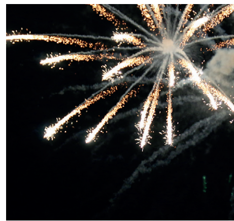
Se cerró la noche con un espectáculo de juegos pirotécnicos.