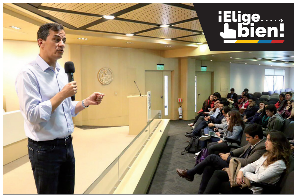
Durante el conversatorio, Nieto habló sobre educación, economía, el proceso de paz, la corrupción, la seguridad, vida y familia, y relaciones internacionales.

En economía, Nieto habló de llegar a que el Estado sea más pequeño y austero con la finalidad de reducir gastos. También se refirió al contexto tributario al cual se enfrentan hoy los colombianos; según él, hoy hay menos ahorro y menos consumo, por lo que él propone "de entrada bajarle un