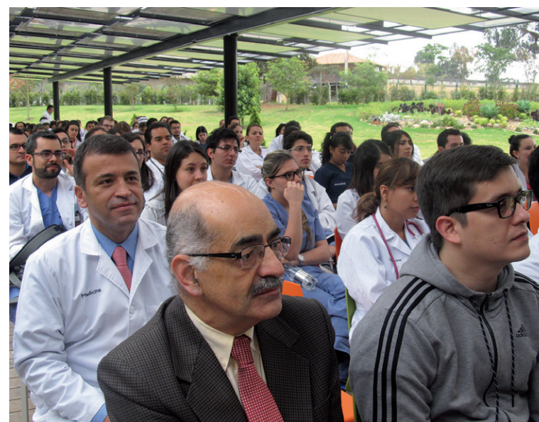
Esta Jornada de Profesor Invitado tendrá como eje central la charla “Actualización en el manejo de Falla Cardíaca”.

Fecha: miércoles 27 de septiembre Hora: de 7:00 a. m. a 8:00 a. m. Lugar: Restaurante de la Clínica Universidad de La Sabana