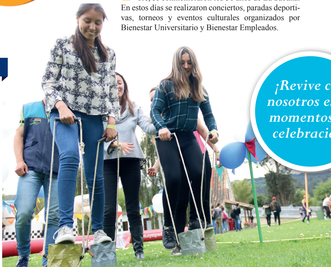
Los ganadores se llevaron bonos para redimir en restaurantes.

¡Revive con nosotros estos momentos de celebración!