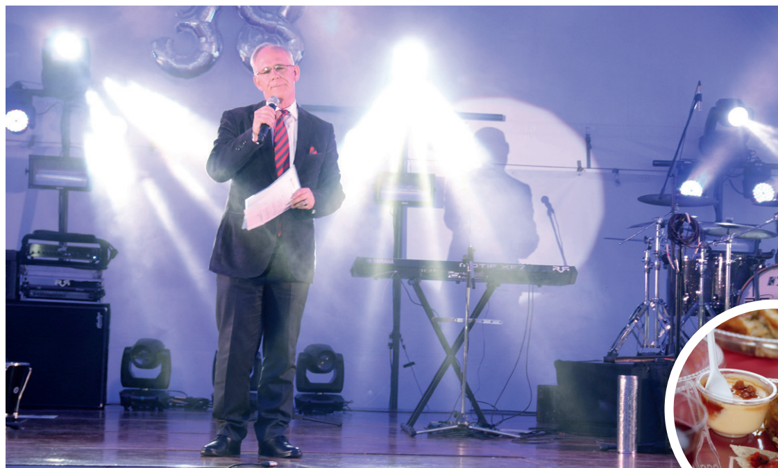
Durante la celebración, el rector de la Universidad se dirigió a los asistentes para agradecerles por la labor y el trabajo en equipo que ha sacado adelante el proyecto educativo de La Sabana.