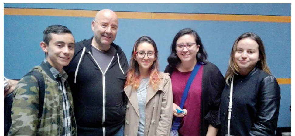
El semillero Sigla funciona como un espacio de creación colectiva, centrado en la formación para la escritura audiovisual.

“La experiencia en el Semillero ha sido vital para descubrir en qué somos buenos, aprender de nuestros profesores y convertir nuestras ideas en productos reales”.