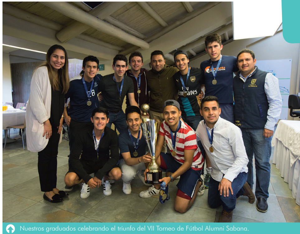
↑ Nuestros graduados celebrando el triunfo del VII Torneo de Fútbol Alumni Sabana.

Desde un principio “Arsenal FC” mostró un planteamiento táctico ordenado, aprovechando a sus carrileros por las bandas y los centros de costado, táctica que les benefició con un gran volumen de ataque, produciendo más de 7 oportunidades de gol en la primera mitad, todas ellas frustradas por el arquero rival.