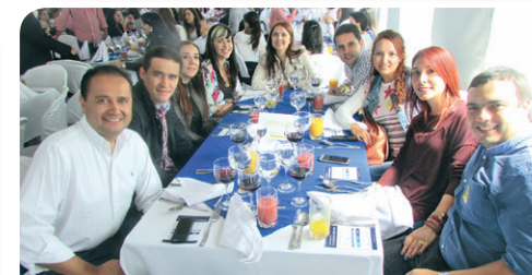
■ El evento sirvió para acercar a los asistentes con la institución y generar un mayor sentido de pertenencia.

Para finalizar, y cumpliendo con el objetivo de la jornada académica, los estudiantes se dirigieron a los salones en donde recibieron cuatro bloques de clases, distribuidos en dos sesiones hasta las 7:30 p. m. el viernes, y dos sesiones el sábado. De esta forma, la Dirección de Posgrados de la Escuela Internacional de Ciencias Eco-