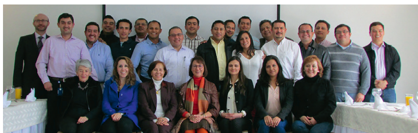
■ Despedida de la V cohorte de la Maestría en Gerencia de Operaciones.

Este evento significó un hito muy importante, con el cual despide de las actividades académicas a los estudiantes que han participado en las cohortes de la maestría, fomentando la unión entre ellos y la Universidad.