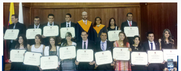
■ Ceremonia de graduación de los estudiantes de las especializaciones en Gerencia Comercial y Gerencia Estratégica.