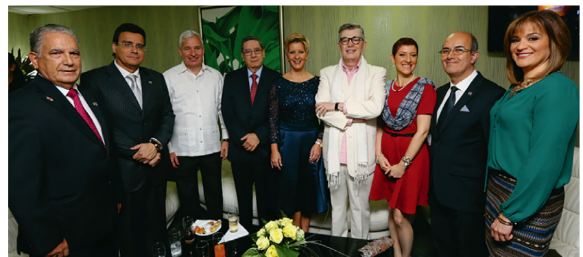
Jurados del concurso junto a la Primera dama de Panamá.

En este certamen, se presentó y reconoció a un grupo selecto de jóvenes estudiantes que, alrededor de la oratoria en español, disertaron sobre el valor del emprendimiento como factor esencial del desarrollo del país y como motor de la cultura solidaria que este genera.