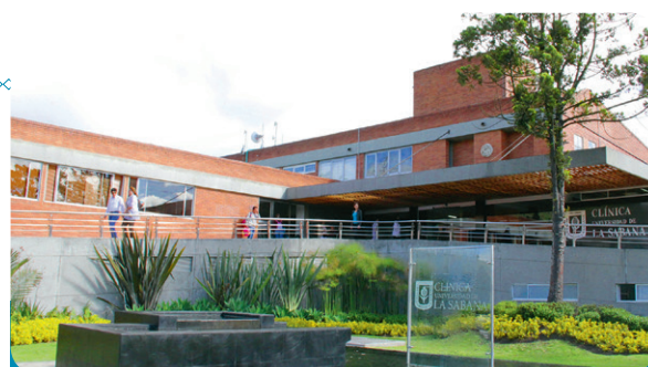
■ La Clínica Universidad de La Sabana se ubica en el puesto 31 de América Latina; en el 15 en Colombia, y en el quinto de las instituciones ubicadas en Bogotá.

La Clínica Universidad de La Sabana seguirá trabajando para demostrar que el trabajo bien hecho influye en los desenlaces de nuestros pacientes, que la política de humanización es viva y permanente, y que con humildad, podemos seguir creciendo con un proyecto de largo plazo para ayudar a la construcción del país.