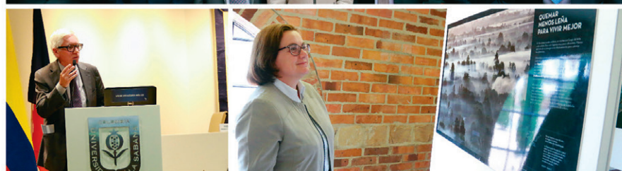
■ Asistentes a la conferencia: “Retos Conjuntos del Cambio Climático”.