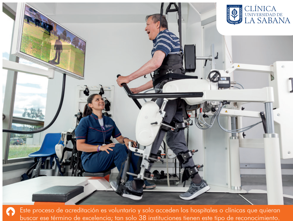
Este proceso de acreditación es voluntario y solo acceden los hospitales o clínicas que quieran buscar ese término de excelencia; tan solo 38 instituciones tienen este tipo de reconocimiento.

“En este tipo de acreditaciones miran el ‘paciente trazador’: ellos visitan la Clínica y van a los servicios de urgencia, cirugía, hospitalización, y hablan con pacientes al azar y les hacen unas encuestas basadas en cómo los atendieron. Eso es