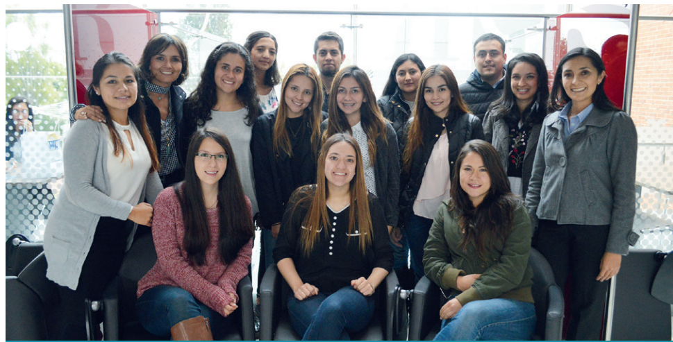
En la Universidad son 30 estudiantes los beneficiarios de esta beca.

El 19 de julio se realizó un encuentro en la Universidad, en el cual participaron las familias de diez estudiantes de pregrado, de diferentes programas académicos, quienes fueron seleccionados como beneficiarios de la Beca Crédito Excelencia Académica de la Fundación Bolívar Davivienda en convenio con la Universidad de La Sabana.