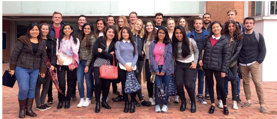
Grupo de estudiantes internacionales y nacionales que participaron de la Inducción organizada por la Dirección de Relaciones Internacionales el pasado 19 de julio.