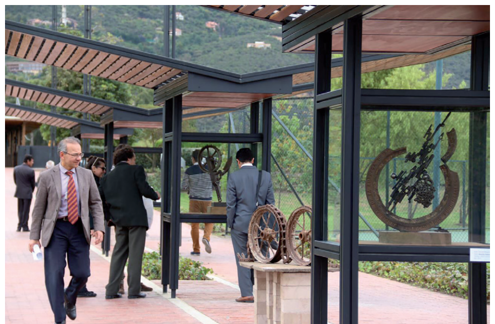
La exposición hace parte del proyecto Campus Cultural, que busca acercar la comunidad universitaria al arte.