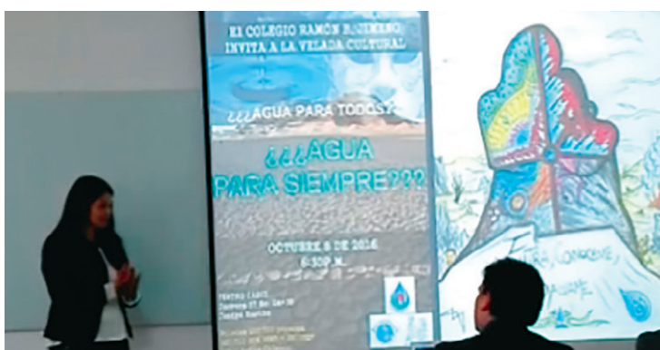
Estos profesores, quienes terminan de cursar satisfactoriamente la Maestría en Pedagogía, pertenecen a la Ruta de Formación Docente, convenio suscrito entre la Facultad de Educación y la Secretaría de Educación.