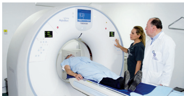
El nuevo equipo permitirá mayor eficiencia y calidad en los procesos diagnósticos.

La Clínica Universidad de La Sabana estrena un equipo de tomografía axial computarizada (TAC), herramienta biomédica que mejorará la eficiencia y la calidad de los procesos diagnósticos, y dará más seguridad al paciente.