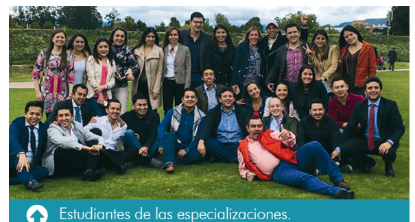
Estudiantes de las especializaciones.