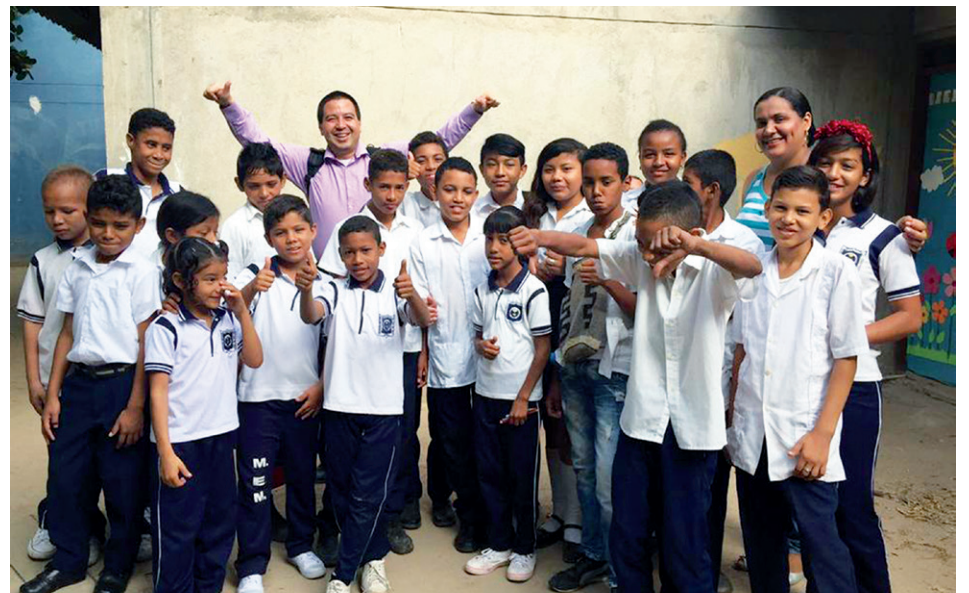
Las asesorías académicas son espacios organizados por la Maestría en Pedagogía para complementar la formación de los 69 profesores que la cursan.

Según Barreto, cada profesor inscrito al programa tiene en promedio a 200 niños a cargo; hay algunos docentes que manejan hasta siete u ocho cursos. Esto, recordando que en total son 69 profesores