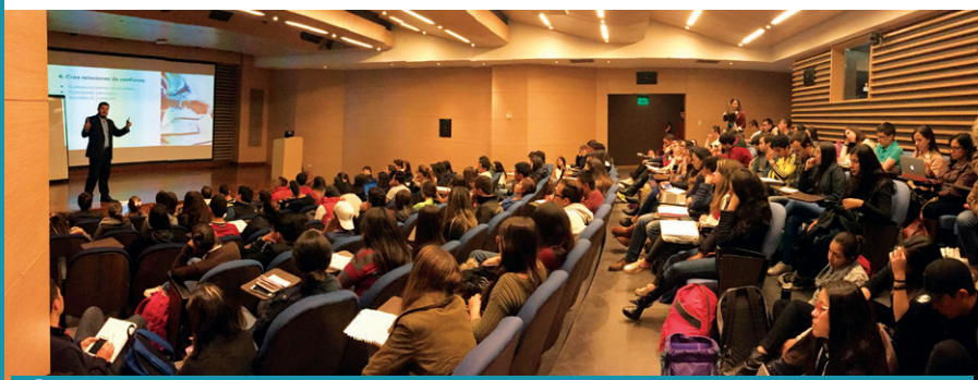
► Durante el conversatorio también se analizaron las características de las demás generaciones.

Este conversatorio fue organizado por el departamento de Mercadeo de la EICEA.