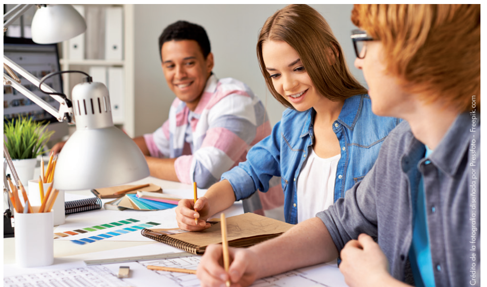
El valor anual del bono por cada hijo se calcula según la categoría del empleado.