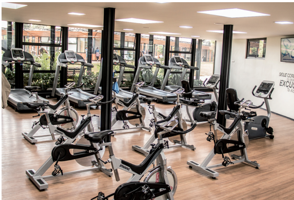
El CAF tiene dos zonas de trabajo: una cardiovascular y otra destinada a ejercicios funcionales que desarrollan habilidades físicas y motrices.