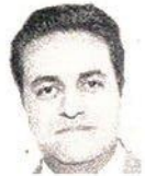
Por Hernán Alejandro Olano García*

● El plan de autonomía, considerado una herramienta creíble para superar el conflicto, no se ha podido implementar